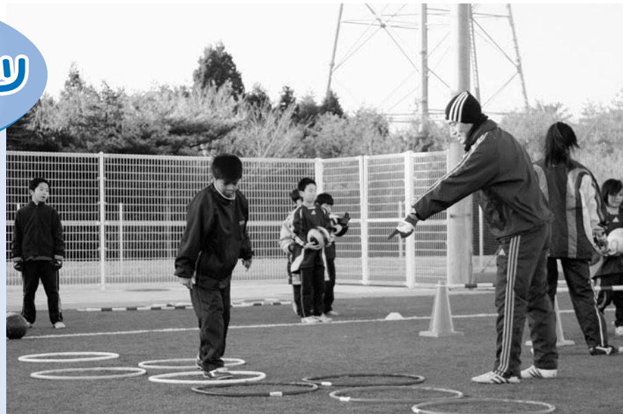
選手にアドバイスをおくる

引率で練習を見学していた保護者の方々にお話を伺いました。「子どもたちは毎回楽しみにしています。指導を受けることができるのはラッキーだし、環境が恵まれていると思います。」