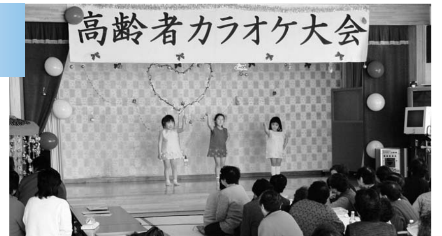
▲老人カラオケ大会でお遊戯を披露した園児たち

広野町老人福祉センターにおいて、カラオケ大会が開催されました。大勢の方が、自慢の歌声を披露しました。また、広野幼稚園の園児も参加しお遊戯を発表しました。 大盛況のうちに終了し、皆さんは楽しいひとときを過ごしていました。