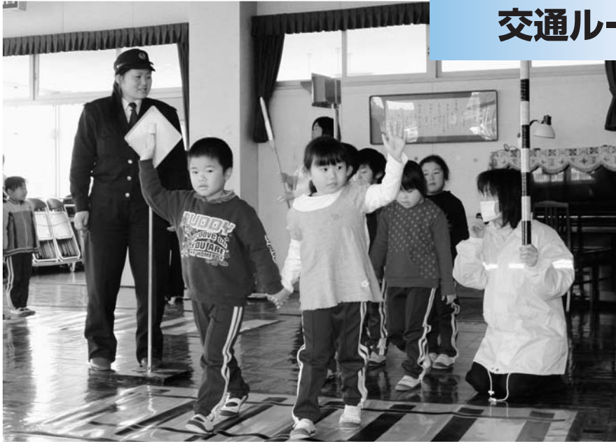
▲踏切の横断もしっかり左右を確認

広野幼稚園において新1年生を対象に交通教室が行われました。模擬交差点や信号機を設置し、信号機の見方や歩道の歩き方などを広野町交通対策協議会及び広野町交通安全母の会、富岡警察署広野駐在所の協力で園児たちは交通ルールを学びました。