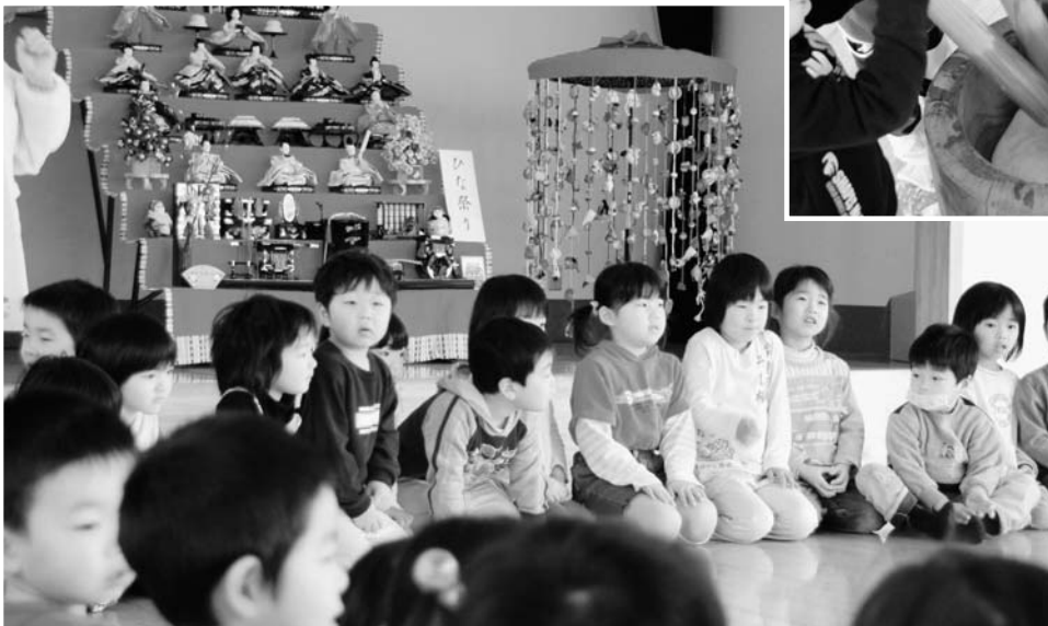
◀雛人形と傘福が飾られた保育所