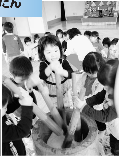
▲園児みんなで餅つき

広野町保育所においてもちつきひなまつり会が開かれました。老人クラブ連合会の皆さんに紙芝居の披露やもちつきに協力していただきました。子どもたちは実際にもちつきを体験し、ひな壇と傘福をバックにおいしそうにもちを食べていました。傘福は老人クラブ連合会の皆さんの手作りです。