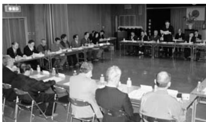
▼行政区長会議の様子