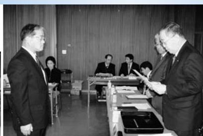
▲行政区長に委嘱状が 手渡される

公民館大会議室にて行政区長会議が開催されました。はじめに、町長より各行政区長に委嘱状が交付されました。その後各課グループより主要施策または事業が説明され、行政区長により要望・質問事項などが出されました。任期は平成22年3月31日となります。