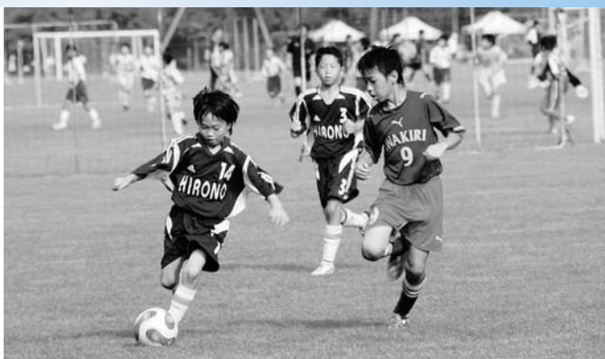
▶ドリブル突破を試みる広野FC

第12回ふたばカップジュニアサッカーフェスティバルがJヴィレッジを会場に開催されました。東北・関東地方含め80チームが実力を競い合いました。 広野町から出場した広野FCは残念ながら予選敗退となってしまいましたが選手たちは他のチームの選手たちと交流を深め夏休みの思い出を作っていました。