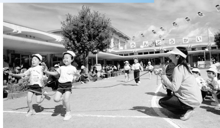
◀一生懸命に最後まで走りぬきました

広野町幼稚園の運動会が園庭でおこなわれ児童たちは元気いっぱい、一生懸命に競技に取り組んでいました。 オープニングでは全園児による鼓笛隊演奏が行われ、園児たちは毎日の練習の成果を家族のみんなに披露しました。 さわやかな秋晴れのなか、かけっこや組体操などの競技に詰め掛けた保護者からは大きな声援や拍手が送られていました。