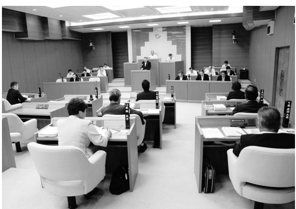
▲議会定例会の様子

その結果、一般会計の決算総額は、歳入では39億4726万1000円、対前年度比17.7パーセントのマイナス、歳出では37億8121万9000円、対前年度比18.1パーセントのマイナスとなっております。 実質収支額は1億6604万2000円、財政調整基金への積立金や、取り崩し額を加減した「実質単年度収支額」は2191万2000円の黒字となりました。また、六特別会計の決算総額は、歳入