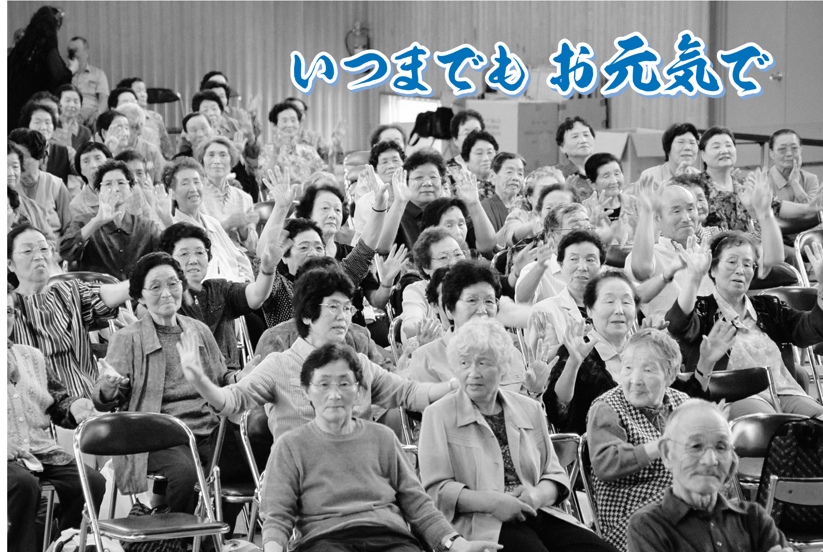
笑顔を絶やさずいつまでもお元気で!!!