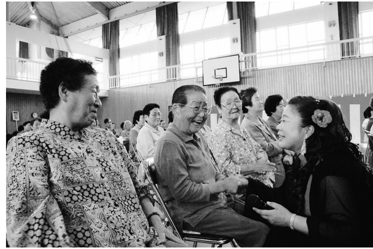
皆さん余興をたのしみました

9月25日現在 広野町の65歳以上の人口は 男511人 女731人 合計1,242人です。