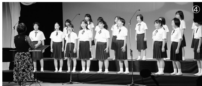
♪ 大熊町立大野小学校