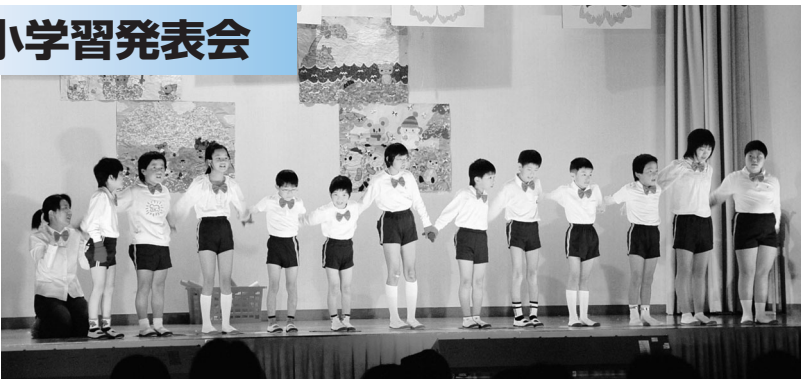
ひまわり・やまゆり学級 「みて！みて！聞いて！」

広野小学校学習発表会が広野町小学校体育館で行われました。1年生49名による開幕劇でオープニングを迎え、各演目へと入りました。児童は授業の取り組みや、放課後のクラブ活動の成果を披露しました。