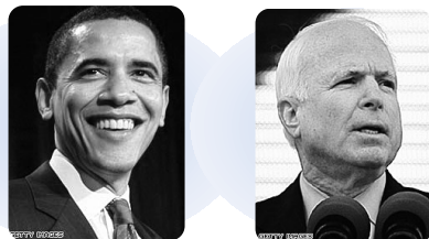
Barack Obama and John McCain. バラク オバマ と ジョン マケイン

■ It is important that everyone votes. みんなが投票することが重要なのです。