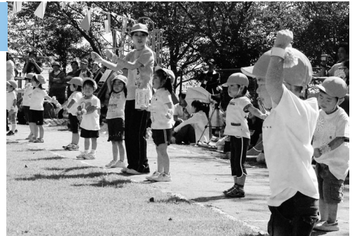
音楽にあわせ踊る子どもたち

広野町保育所で秋恒例の運動会が開かれました。入場行進をして運動会のうたを元気に歌いました。準備体操をしてから11種目の競技に取り組みしました。「崖の上のポニー」ではうたに合わせて、たんぼぼ・ひまわり・ぼらの子どもたちがかわいらしいダンスを披露しました。子どもたちの姿に詰めかけた家族の皆さんからは大きな声援がおくられていました。