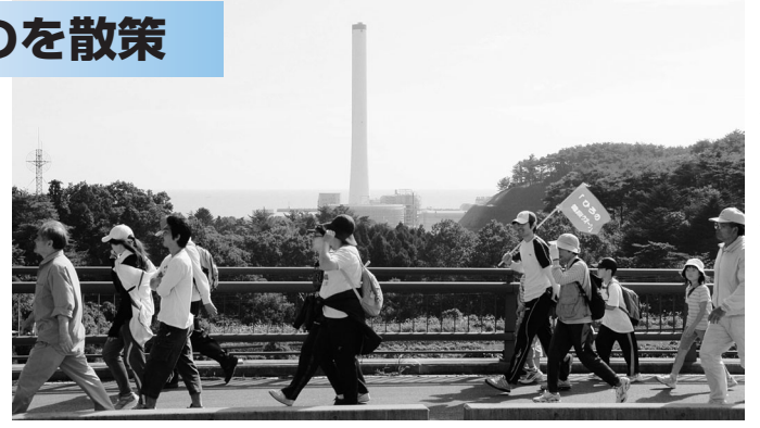
秋の風景を楽しみながら歩く参加者

第9回ひろの健康ウォークが二ッ沼総合公園をスタート・ゴール地点に行われ、約150人が参加しました。参加者は6kmコースと10kmコースに分かれ、昨年とは違うコースの眺望やひろのの秋を満喫しながら家族や友人たちとウォーキングを楽しみました。ゴール後にはとん汁が振舞われ、疲れた体を癒しました。