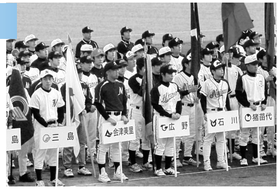
町村対抗野球 開会式の様子▲

第2回市町村対抗軟式野球大会が福島市のあづま球場で行われました。広野町は1回戦で石川町と対戦し、一時4点差を追い越す熱戦を繰り広げましたが特別延長戦の末惜しくも敗れてしまいました。