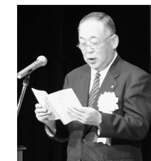
あいさつする山田町長