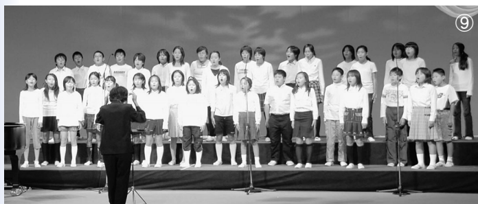
♪ 埼玉県三郷市立早稲田小学校