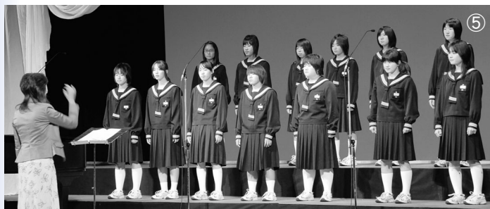
♪ 大熊町立大熊中学校