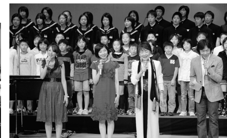
フィナーレは弘道お兄さんも参加しての「とんぼのめがね」合唱です