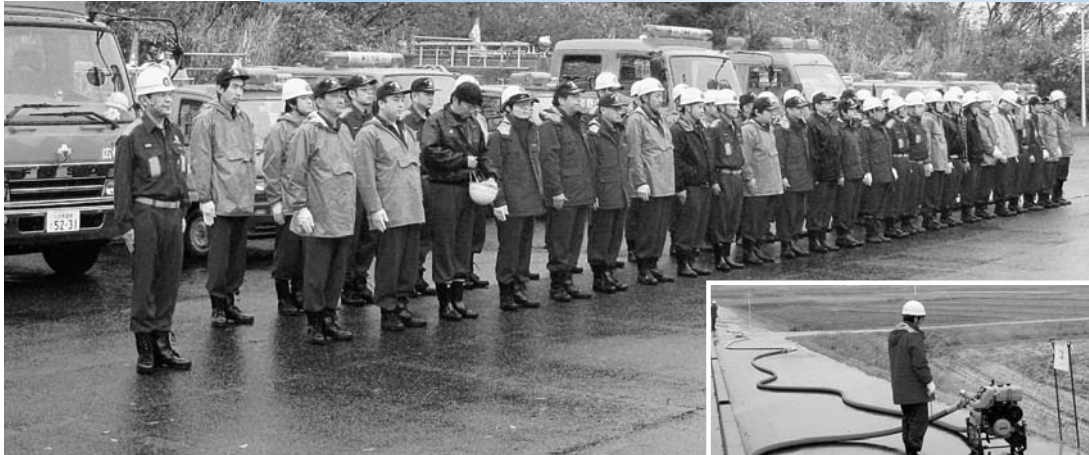
▲規律ある動作で取り組む団員のみなさん