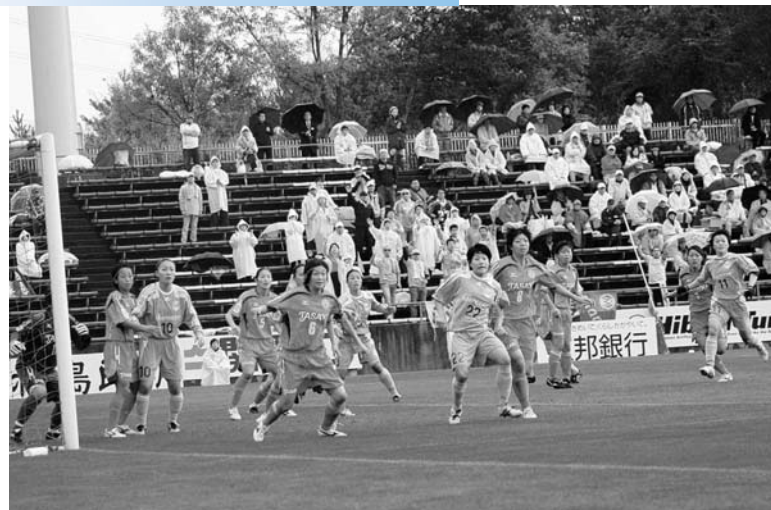
◀雨が降りしきるなか熱戦を 繰り広げたマリーゼイレブン

東京電力女子サッカー部マリーゼのホーム最終戦が行われました。それに合わせ、スポーツの里ふたば支援イベントが行われました。選手のサイン入りユニフォームなどが当たる抽選会や双葉地方の特産品を販売するブースが設けられ訪れた観客などに双葉郡をPRしました。試合はTASAKIを相手に惜しくも0-1のスコアで敗れてしまいました。雨にもかかわらず足を運んだサポーターからはあたたかい声援が送られていました。