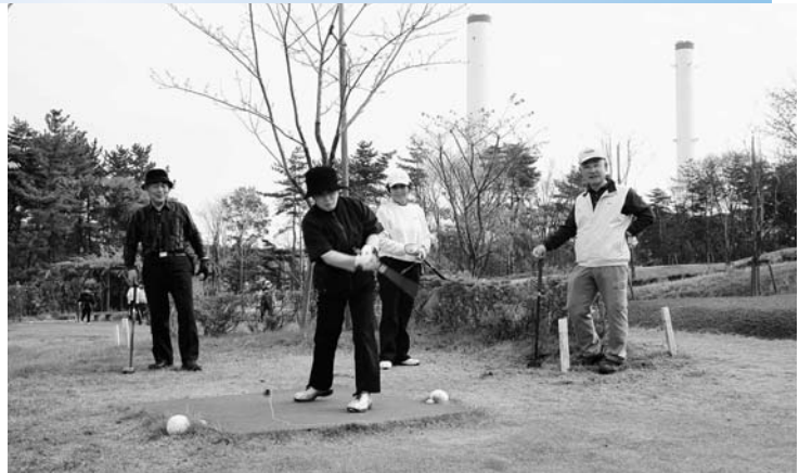
▶プレーを楽しんだ参加者の皆さん

「パークゴルフデビュー」が企画した福島パークゴルフツアー・広野町PG協会交流会が二ツ沼総合公園パークゴルフ場で開催され、北海道各所から参加したメンバーと広野町PG協会のメンバーが交流を深めプレーを楽しみました。 「パークゴルフデビュー」は北海道札幌市を拠点に全国のパークゴルフ情報を掲載しているパークゴルフ専門誌です。今回は札幌などを中心に33名が広野町パークゴルフ場を訪れました。