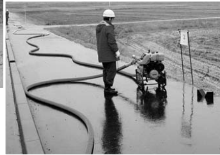
つなぎ訓練の様子▶

火災が多く発生する時期に備え、団員の迅速な動作や機械器具の確実な操作を行うためつなぎポンプ訓練が行われました。団員のみなさんは規律ある動作で訓練に臨んでいました。雨の降る中、お疲れさまでした。