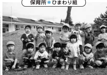
保育所*ひまわり組