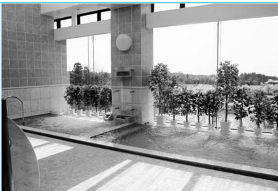
麦飯石を使用した浴槽

今年5月に各戸配布いたしました広野町リフレッシュ施設「無料入浴券」の有効期限は平成19年3月31日までとなっておりますので、まだご利用になっていない方は是非ご利用されますようお知らせします。