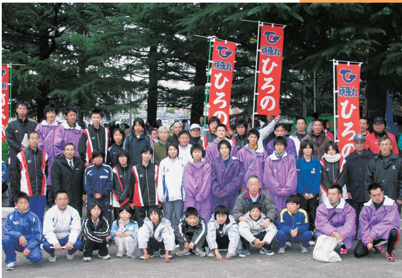
11月19日に開催されたふくしま駅伝(県庁前ゴールにて) 詳細は次号でお知らせします