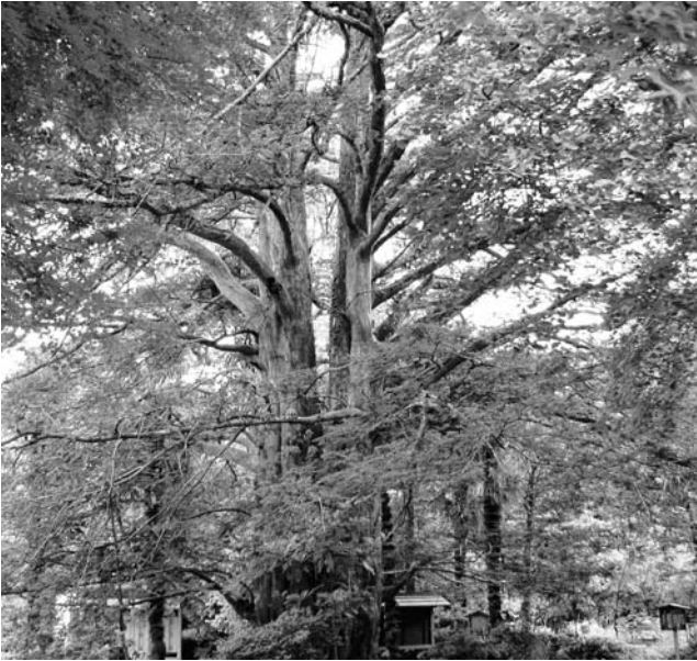
町の天然記念物に指定された林蔵寺のカヤ