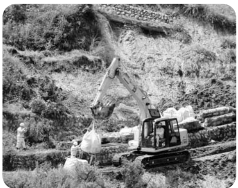
災害復旧にあたる地元業者

企業体を組むという方法もたしかにありましたが、今までの工事金額の実績、また、今回は建築ということ、やはり工期内に完成させるためには、技術力のある大手企業しかないということ、業者を選考しました。