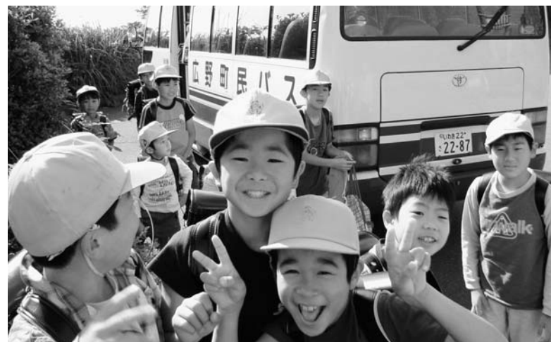
町民バスで学校に通う小学生

(3) 「第3次町勢振興計画の周知と取り組み」については、計画の示す方向や施策について、町民の皆様にご理解いただくことが何にも増して重要であり、また、このことが町民の皆様と行政が一体となったまちづくりに取り組むために最も必要なことであるため、今後、各種団体や事業所など、多くの皆様との意見交換会等を開催して周知に努めます。