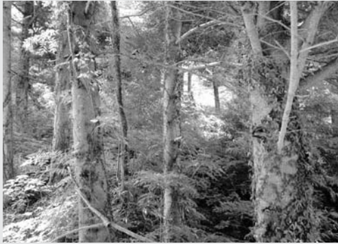
自然そのままの雑木林

地方税法の一部が、平成18年3月31日公布、同年4月1日施行となったことから、「広野町税条例の一部を改正する条例」を3月31日付で専決処分したため、これを承認しました。 改正の主な内容は、均等割の見直し、森林環境税創設による均等割額の変更、老年者控除の廃止、65歳以上の非課税措置の廃止、定率減税の見直し、非課税限度額の引き下げなどで、いずれも住民の負担が増す内容の改正でした。