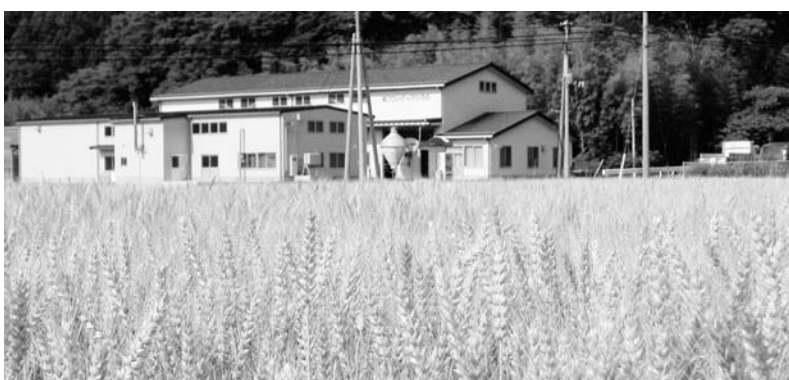
刈り取り間近の広野産小麦

米価が低迷する中にあり、農家の米づくりに重点を置いた経営から脱却するためには、転作農産物の販路確保に向けた努力が必要であるという意見に集約された。