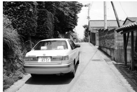
車のすれ違いもままならない下浅見川・本町地区

本町では、その計画に基づき事業の推進を図るため、積極的な用地交渉を展開して多くの地権者の