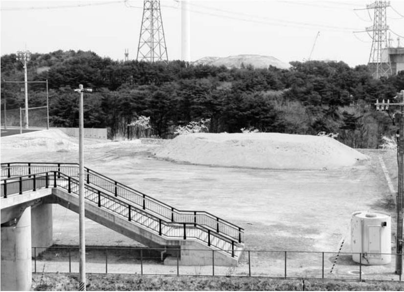
サッカーグラウンド敷地造成地