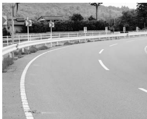
交通事故があとを絶たない折木・上原地区

町として、この環境を守り、将来の世代に引き継がねばなりません。水源地として、教育、産業の場として、人工林・自然林、町有地・民有地を問わず共有の財産として、総合的に保全して行かなければならないと思います。