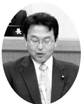
新妻 良平 議員