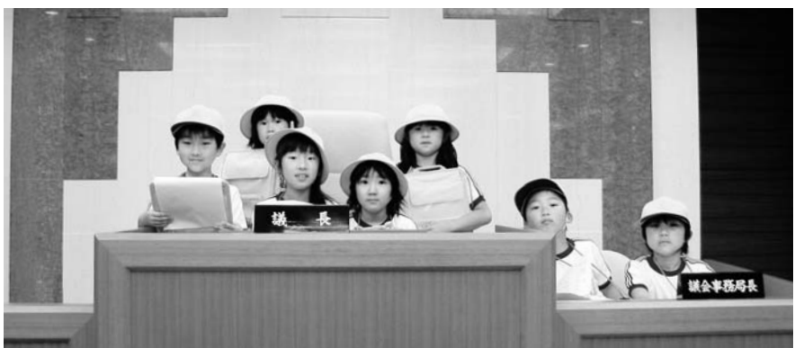
「町たんけん」で議場を見学した小学生