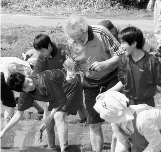
田植えを体験する JFA アカデミーの子どもたち