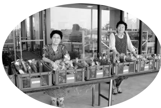
新鮮な地元野菜を「ふるさと広野館」で販売中