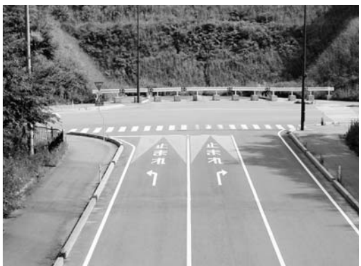
延長工事が待たれる県道広野～小高線（東電入口付近）

小高線整備促進協議会」を発足させ、積極的に県に対して事業推進についての要望活動を展開しています。