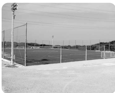
JFAに無償で貸している広野町サッカー場

舎(中学生用)第1期新築工事でスタジアム南側に建設、平成19年2月下旬完了予定 ②サッカー場整備としてクラブハウス新築工事、平成19年2月下旬完了予定)について説明を受けた。