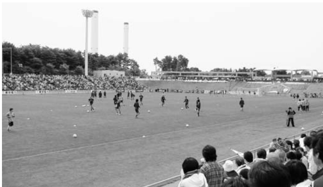
男子寄宿舎に隣接するJヴィレッジスタジアム

猪狩新一郎議員 300日以内の完成を目指すために大手企業を指名したということですが、落札業者は独自で工事を行うのですか。