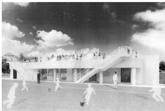
サッカー場クラブハウス完成予想図

施行となったことから、「広野町重度心身障害者医療費の給付に関する条例の一部を改正する条例」を3月31日付で専決処分したため、これを承認しました。