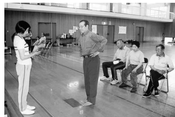
高齢者の体力テスト