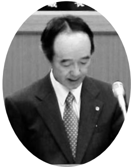
松本 浩司 議員