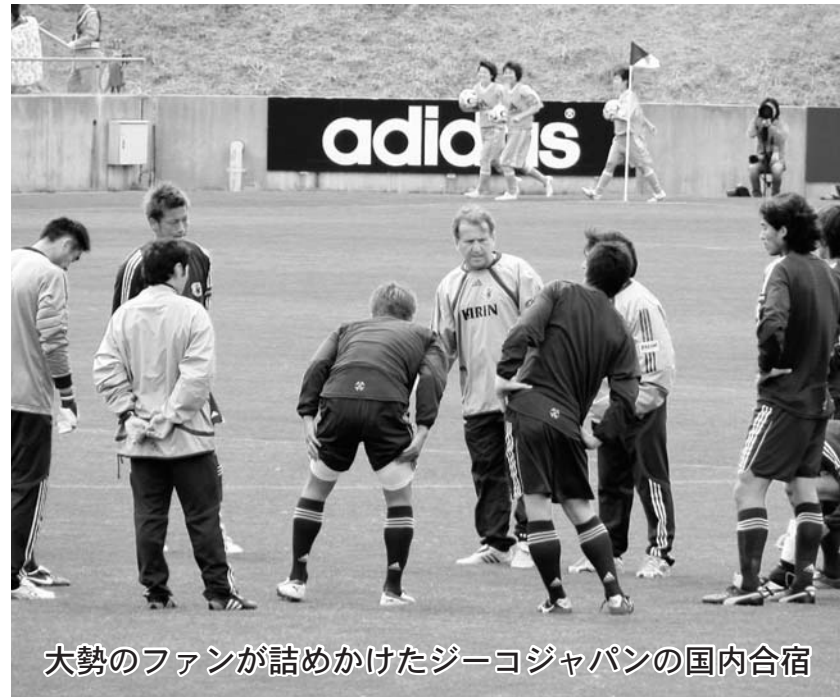
大勢のファンが詰めかけたジーコジャパンの国内合宿