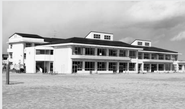
夏休みに改修工事が行なわれる小学校

昭和62年度に移転・新築された広野小学校の校舎について、採光ガラスの破損、外壁および屋根塗装の劣化が進行していることから、補修工事を行なうとともに、新たにコンピュータ教育専用教室を整備する工事の入札を去る6月5日に実施した結果、堀江・西本特定建設工事共同企業体が9,400万円で落札したため、同社との工事請負契約の締結を承認しました。