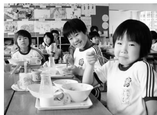
おいしい給食に思わずニコリ

【結果】平成18年4月1日から図書室の開室時間が1時間延長され、午後6時15分まで利用できる