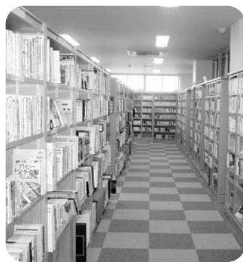
利用しやすくなった図書室

●図書室の開室時間が、現在の午前8時半から午後5時15分という時間帯では、勤労者が利用しにくいという声がある。 時間の延長または変更等を早々にお願したい。