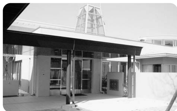
特別養護老人ホーム「リリー園」（楢葉町）