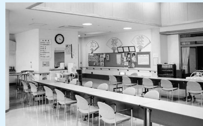
広野町デイサービスセンター「広桜荘」

老人福祉サービスはもとより、介護している家族を助ける意味においても、土曜日くらいはデイサービスセンターを開所すべき。