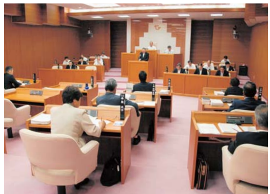
9月定例会のようす