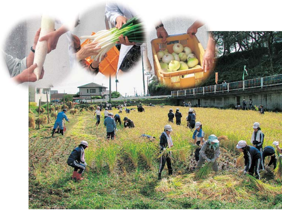
手から手へ生産者から届けられる地元食材と稲刈りを体験する小学5年生