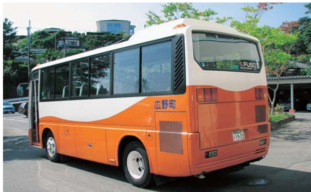
排ガス対策が課題のマイクロバス