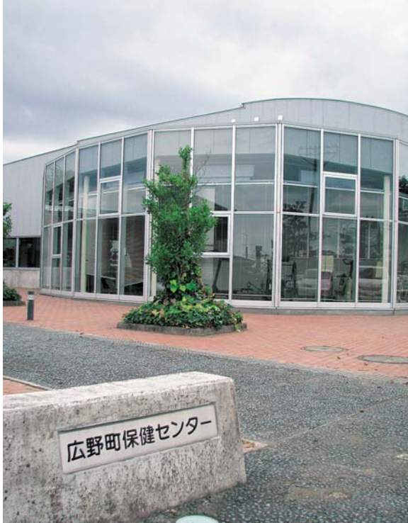
健康づくり事業のかなめ保健センター