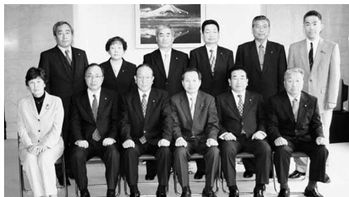
議員一同本年もよろしくお願い申し上げます。

に12人の議員が選任されました。新人議員4人を含め、全議員が心機一転、新たな気持ちで町民の付託に応えるべく、住民福祉の向上をはかり、「心に潤いが実感できる町づくり」を目指し、鋭意努力してまいる所存であります。 どうか本年も、より一層のご指導、ご協力を賜りますようお願い申し上げますとともに、本年が皆様にとりまして幸せ多い年でありますよう、心よりご祈念申し上げます。新年のあいさつといたします。