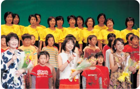
▲第14回ひろの童謡まつり音楽祭