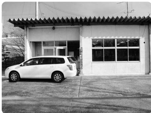
広野町土地改良区 (苗代替地区)

渡辺産業グループリーダー 土地改良事業については、各農家の水田にともなう水利等の整備事業あるいは中山間直接支払の制度にともなう委託事務などを行つています。(総代は土地改良区の名簿に登録された460人ほどの選挙人から32人が選出される。前回は無投票)