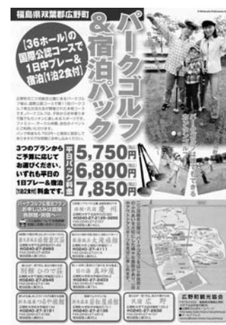
パークゴルフ&宿泊パック案内

北郷 1日プレーと宿泊がセットになった「パークゴルフパック」については、現在までどのくらいの利用がありますか。