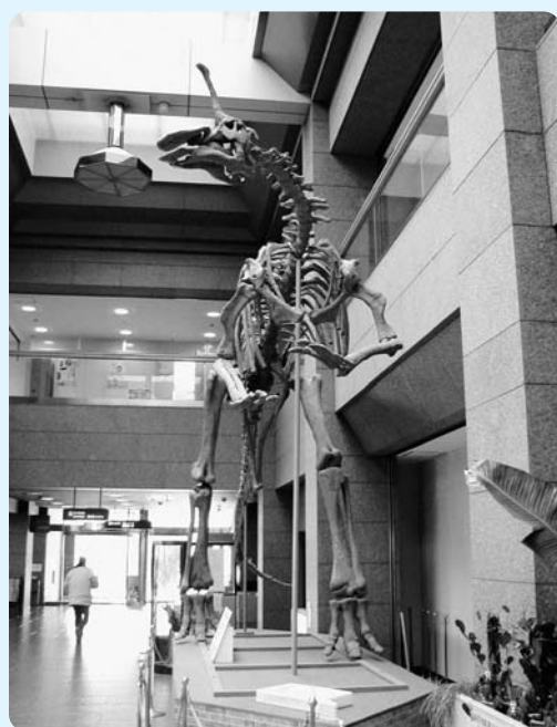
チンタオサウルスの模型（役場庁舎内）

発見された化石は、肉食恐竜のけい骨および歯、肉食恐竜のけい骨、さらには被子植物の果実の化石などで、収集した化石等は、チンタオサウルスの骨格模型、