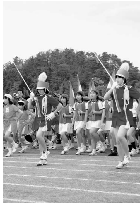
広野小学校鼓笛隊