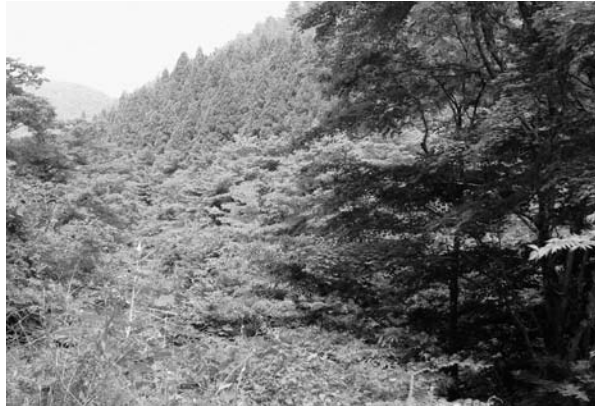
処分方法が課題の「部分林契約地」

会からは伐採しないで処分する方を考えてほしいと要望されています。今回の補正は、この問題を解決するための実態調査費用ですが、町としては、どういう形であれ処分することに変わりはないため処分という言葉を使いました。