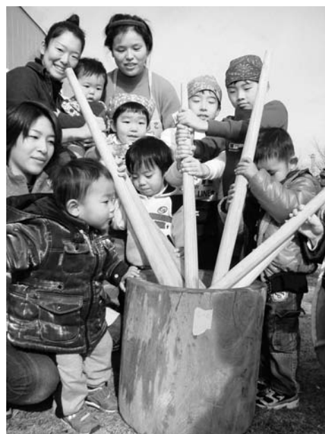
餅つき大会（保健センター）

町長 「収支均衡型」財政構造への転換をはかることが大きな課題となっており、歳入面では、徴収率の向上による町税収入等の確保に努め、歳出面では、より一層の経費節減による財源の確保と、施策の優先順位による選別を行い、財源の計画的、重点的な配分に努めるとともに、将来世代に過度な負担を残さないよう地方債発行額を抑制する等、財政の健全