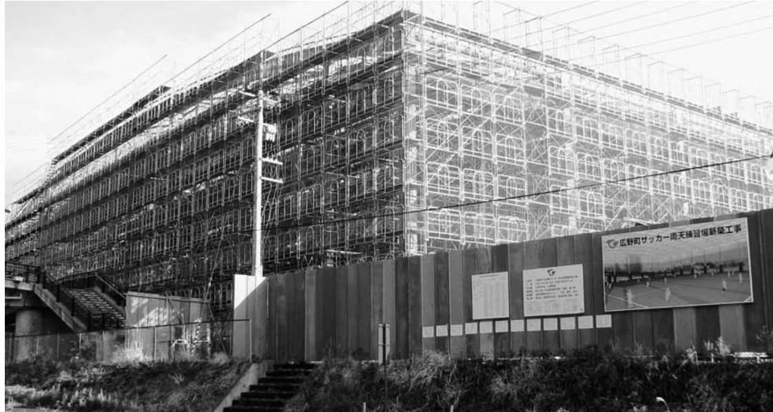
工事が進む広野町サッカー雨天練習場