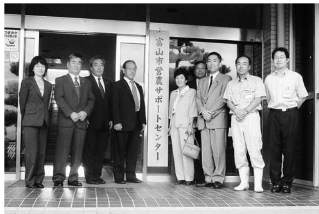
富山市営農サポートセンター

富山市農業センターは、農業に興味を持つ人に栽培技術を習得してもらい、農業サポーターまたはヘルパーとして活動してもらうことを制度として創りあげています。農業の現状を的確にとらえている先を見とおした施策であり、当