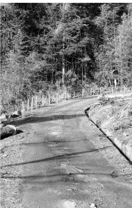
改良整備予定の町道「田戸作線」

この事業は、個人住宅の改良を支援するとともに消費活動を促し、さらには地域経済の活性化につなげるため、町内業者に施工させた町民に対して補助金を交付する事業です。 ただし、補助金額は同一住宅1回限り、最高20万円を限度に工事金額の1割を助成する内容です。たいへん良い制度なので、次年度からの導入に向けて準備するよう要望しました。