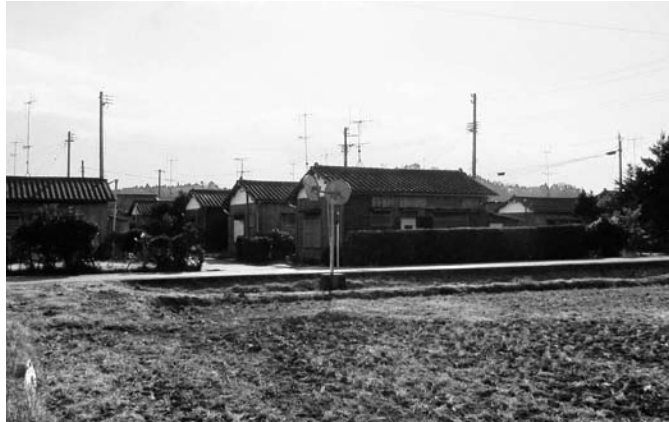
町が土地の一部を購入する広長住宅

については、法律が仮に通つ国政選挙で使えるよつになつても、準備の都合上、次の選挙からすぐ使えるよつものではないかと、ので、今後の法改正等を受けて導入を検討して行きます。