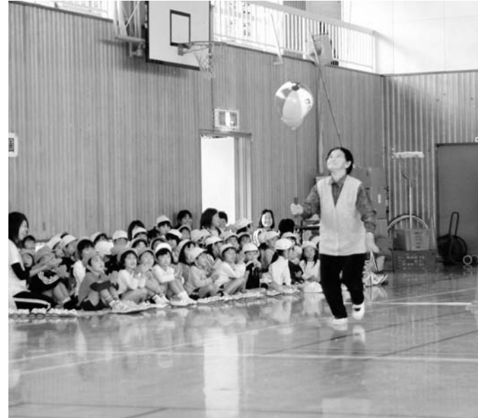
老人クラブスポーツ大会（中央体育館）

さらに、被用者保険加入者の被扶養者の特定健診と保健指導についても、各保険者から委託されることが予想されるため、それらを踏まえて事業者との事前協議や体制づくりに努めます。