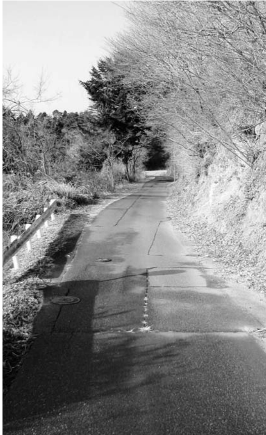
改良整備予定の町道「苗代替線」

山田町長 私はそういう考えをもって伊東市を表敬訪問しています。あとは行政と民間が一体となつて活性化が図られるよつ、交流の場を持ちたいと思つています。