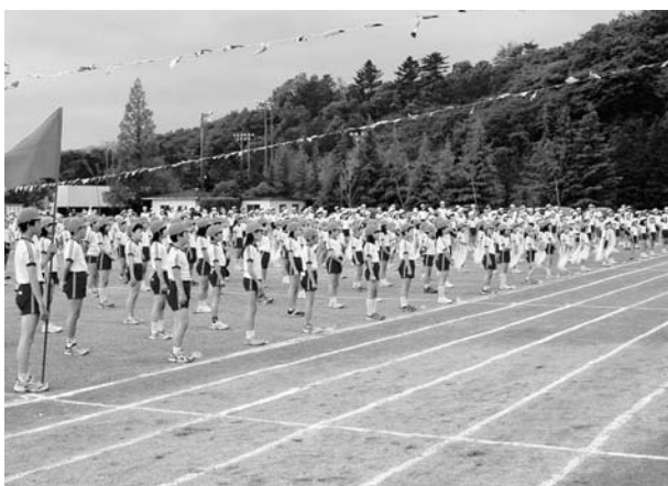
白線が引かれた校庭 (小学校運動会)

いては、ふるさと農道と苗代替線の交差点から西に向かつて、長畑の集落に通ずる部分までの約600メートル、それから長畑集落の方に直接結びつけるよつな取り付け道路として約100メートル、全体で700メートルほどの整備を予定しています。また、田戸作