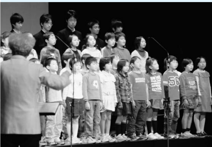
音楽祭で童謡を歌う子どもたち

「議会活動」または「議会だより」について、皆さまのご意見・ご感想をお寄せください。お待ちしております。