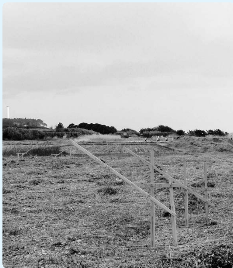
工事が始まった県道「広野・小高線」(下浅見川地区)

建設事務所より、今年度中に着手したいとの回答を得ました。下浅見川地区の用地取得については、平成2年度に町道桜田・久保線道路新設事業として着手し、1件を残して売買契約が締結されています。