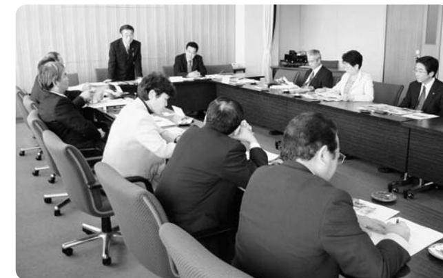
「おおぐち議会だより」を研修（大口町議会）