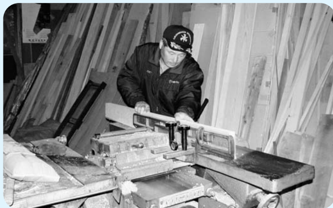
地元業者の受注機会の拡大を求めて

住宅リフォームへの町の助成と、「小規模修繕希望登録制度」の創設を行なう必要があると考えますが、いかがですか。