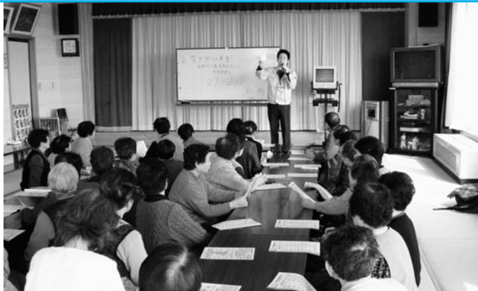
後期高齢者医療制度説明会（老人福祉センター）

広域連合議会議員の選挙まで行ない、この制度の運用に関わっている以上、私は賛成します。