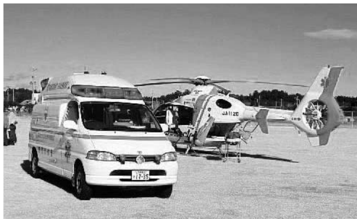
救急医療用ヘリコプター「ドクターヘリ」

次に、民間委託等の推進については、現在、老人福祉センター、広桜荘、二ツ沼総合公園を指定管理者制度の活用により管理運営していますが、たいへん厳しい財政状況ですの