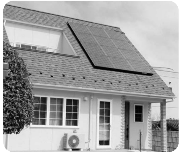
太陽光発電システムを設置した住宅

根本企画グループリーダー 現在、4月1日からの施行に向けて、広野町新エネルギーシステム設置費補助金要綱の整備作業に入っているところです。