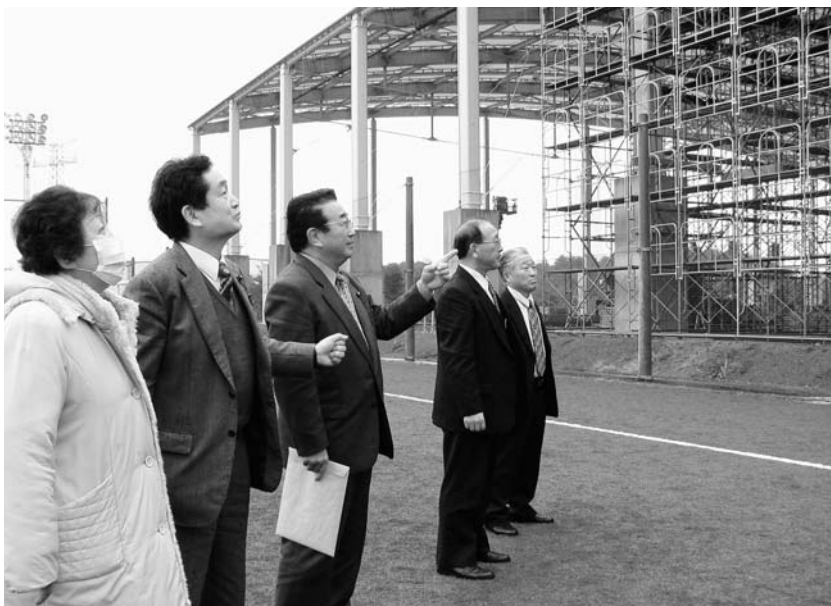
サッカー雨天練習場現地調査

この調査は、部分林の中から調査地点を抽出して、10ヘクタールほどの調査を行なうものですが、調査費を有