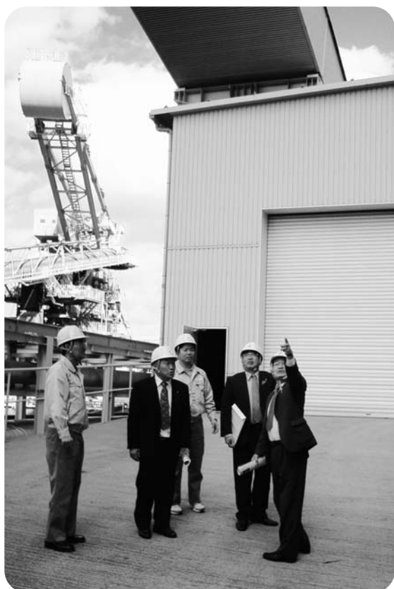
バイオソリッド燃料と石炭の混焼施設を視察