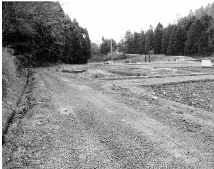
農道舗装の対象になっている灰作地区農道