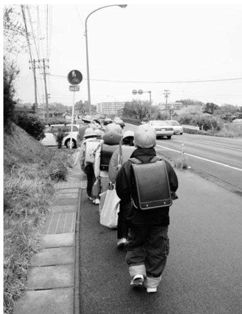
集団登校する小学生

また、譲渡した住宅の住環境および防災面については、今後道路整備等を含め、個別に検討して行きます。