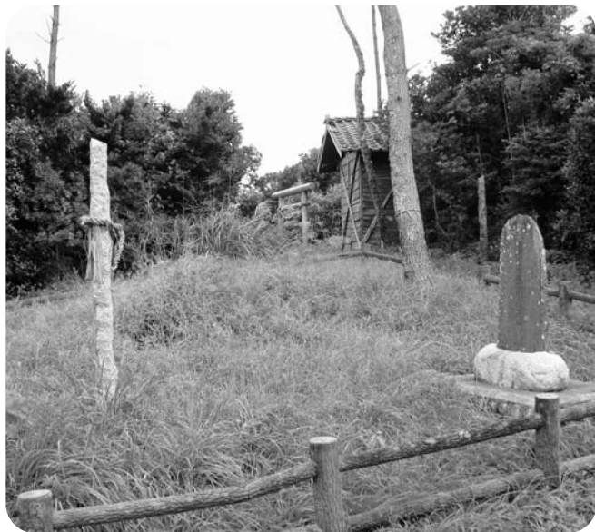
「奥州日の出の松」跡地

現在浜街道を整備中ですので、今後、その状況を見ながら移植できるような方法をとって行きます。