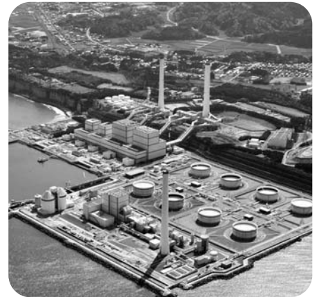
東京電力㈱広野火力発電所

また、6号機増設にかかる電源三法交付金の整備計画は、まだ策定していませんが、有効に活用できるよう各種事業を検討して行きます。