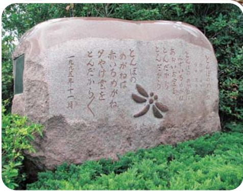
JR広野駅発車ベルメロディー化記念式典(上) 築地公園にある童謡「とんぼのめがね」の碑(下)