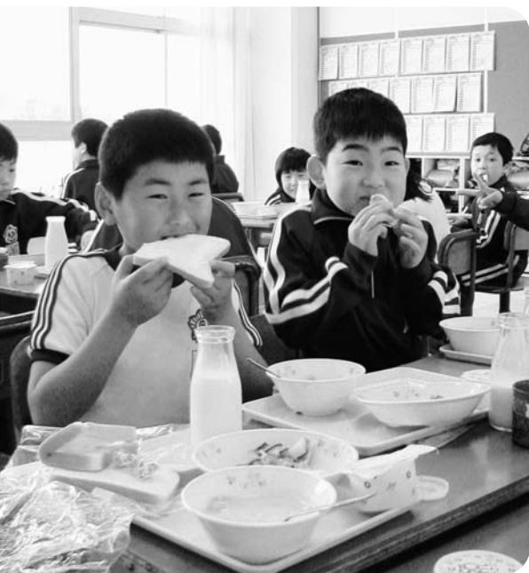
笑顔が絶えない学校給食（小学3年生の教室）

しかし、今後については、小麦・食用油などの原材料や燃料費の高騰による輸送コストの増などにより、食材の値上げが続き、現状のままでの提供が極めて困難になっていることから、値上げせざるを得ない状況だと聞いています。