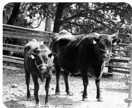
農家で飼われている和牛

当町の畜産農家は和牛繁殖農家なので、現状で稲ホールクroppサイレージへの取り組みは困難です。