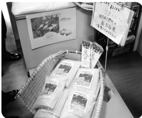
静岡県伊東市で「広野産あひる米」は大好評