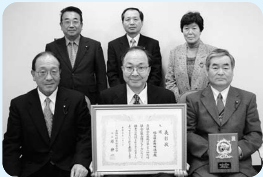
表彰を受けた坂本議長(左から1番目)と広報委員