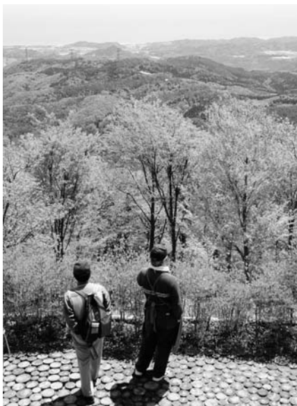
眺めの良さが人気の五社山山頂

ダー バラを伐採した経緯はありますが、また再度整備します。なお、山頂北側の支障木については、国有地の部分もありますので、それらの土地の形状や土地の状況を確認し、伐採できるものであれば対応します。