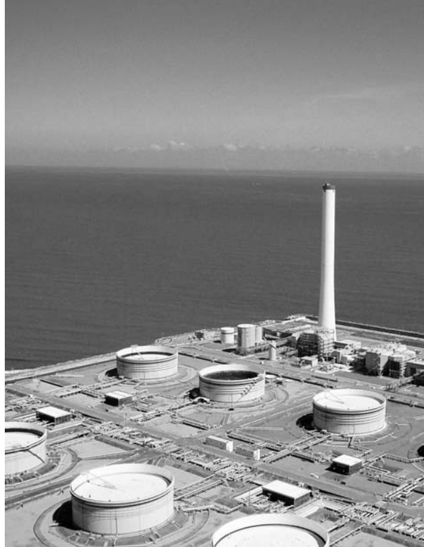
交付金の対象となった広野火力の石油備蓄タンク