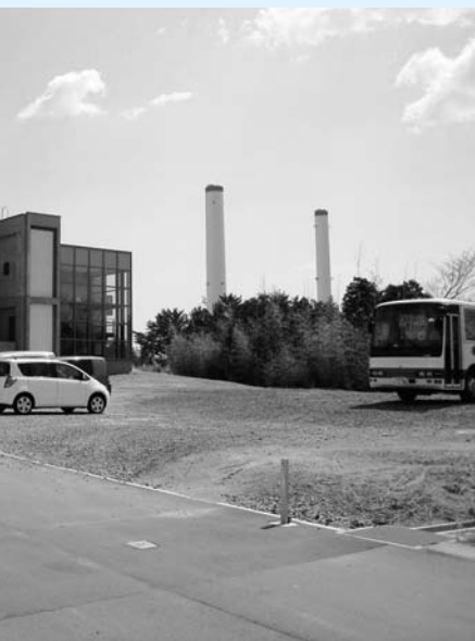
サッカー支援センター

男子寄宿舎第2期工事として、高校生用居室部分の整備のため、サッカー支援センターを増築します。 なお、工事費の8割は県から補助されます。