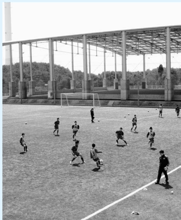
完成したサッカー雨天練習場（写真奥）

山田町長 まったくそのとおりです。少しでも地元企業の利益につながるよう今後も検討して行きます。