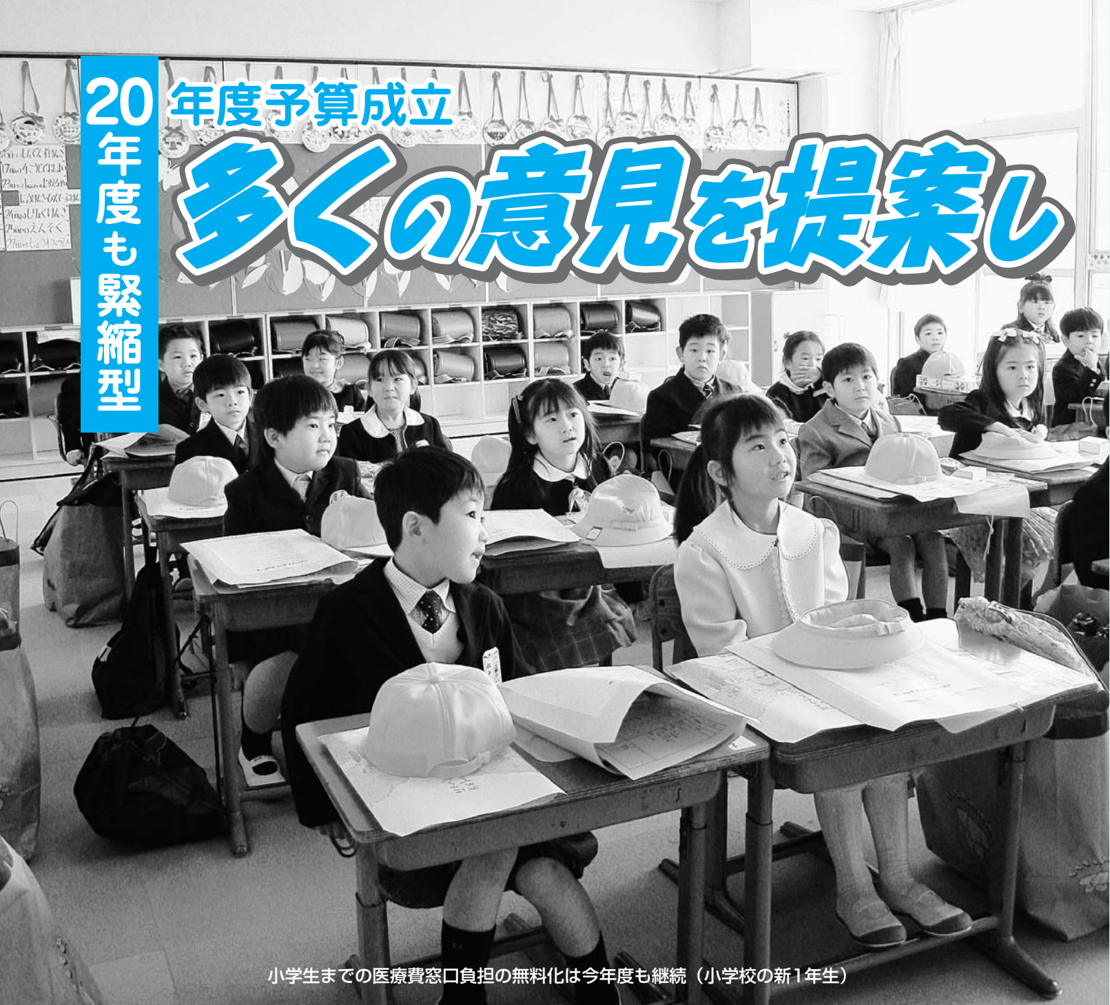
小学生までの医療費窓口負担の無料化は今年度も継続（小学校の新1年生）