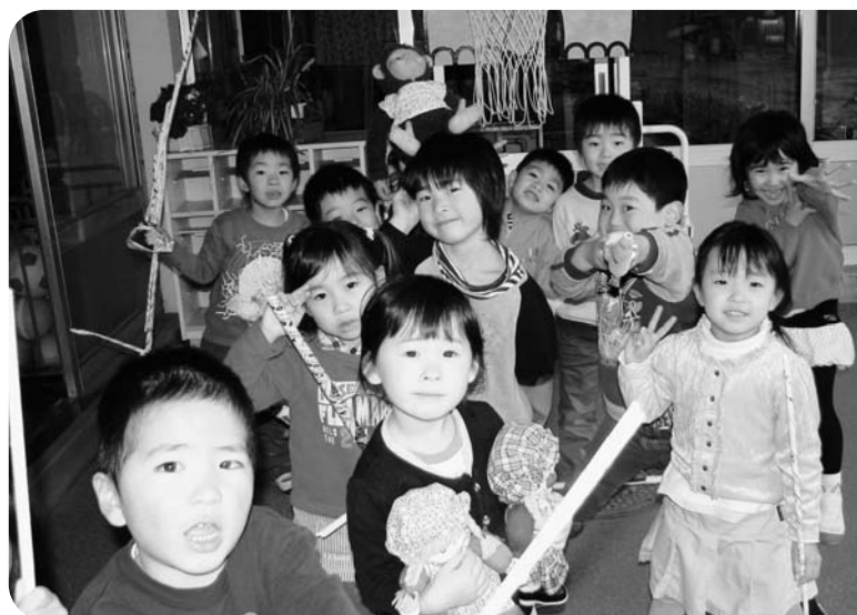
元気に遊ぶ子どもたち（幼稚園預かり保育）

委員会としては、幼稚園における現状の職員体制で対応でき、かつ、勤務時間の問題等は生じないのか、また、幼稚園と保育所の「幼保一元化」に向けた基本的な考えについて質問しましたが、現行の人員でも実情に即した勤務体制にすれば対応可能であり、幼保一元化教育については、いろいろ検討し、実現に向けて進めて行くとの回答を得ました。