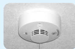
住宅用「火災報知器」

町営住宅153戸に1戸あたり平屋建は1基、2階建は2基の割合で住宅用火災報知器を設置します。