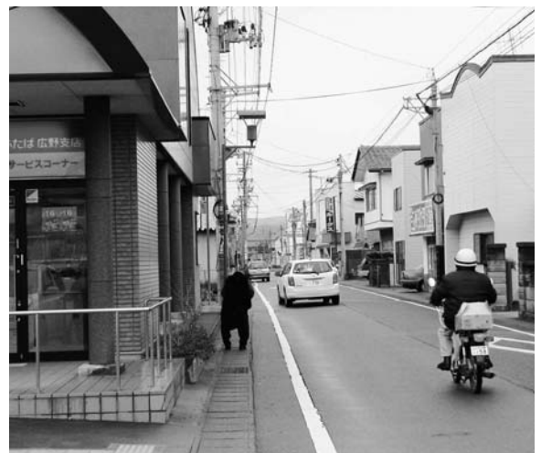
人どおりの少ない駅前通り商店街