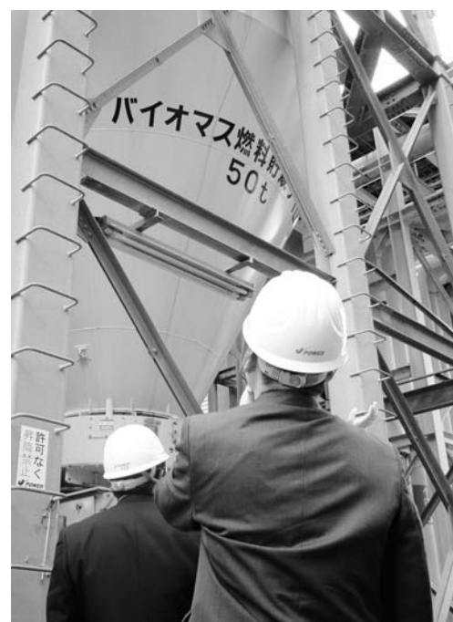
バイオマス燃料貯蔵施設