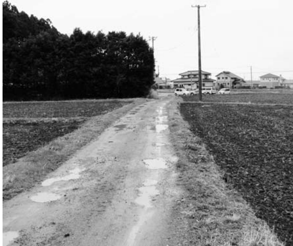
20年度事業で舗装される代地区農道