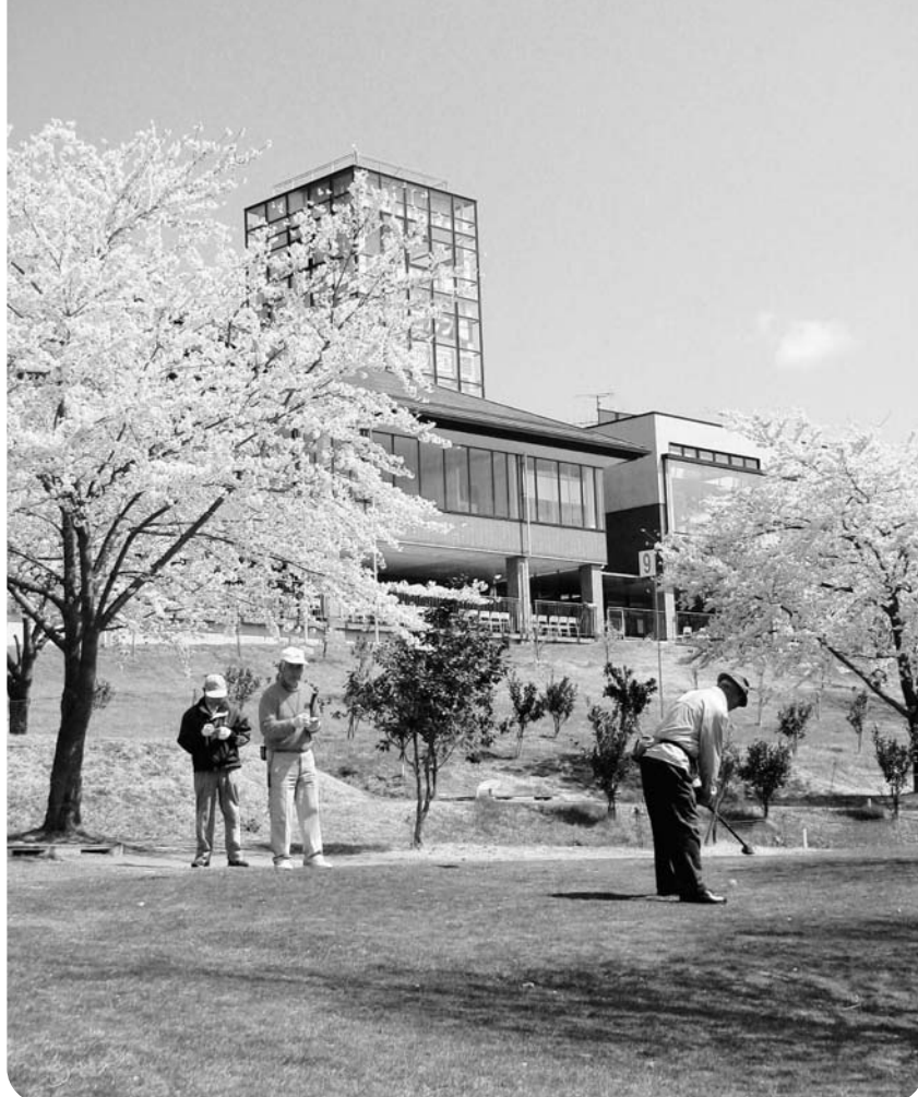
“春爛漫” パークゴルフを楽しむ人たち（二ツ沼総合公園）