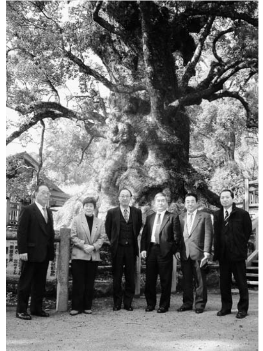
蒲生町のシンボル 大クスノキ

蒲生町には役場のとなりの蒲生八幡神社境内に樹齢1,500年とも言われる日本一の大楠があり、町は「蒲生のクス」をキャッチフレーズに熱気あふれる町づくりを展開しています。