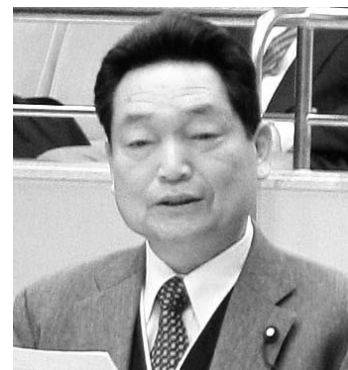
北郷 幹夫 議員

北郷 集中改革プラン（平成17年度～平成21年度までの5ヶ年計画）を策定して3年が経過しますが、予定どおり進んでいますか。