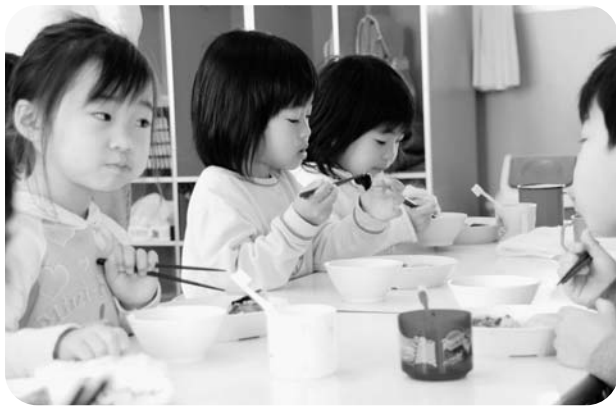
町民の安全が第一（保育所）

町長 近年のさまざまな食品をめぐる問題の発生時には産業グループが担当し、関係機関と連携しながら、じんそくに情報収集し、町民の安全に対応して行きます。