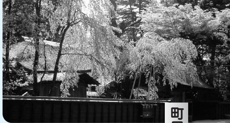
小京都・秋田角館の武家屋敷

町民の親ぼくと融和を深めることを目的に、6月28日(土)から29日(日)まで、1泊2日の行程で町民号が実施されます。 行く先は、秋田県角館・田沢湖方面の予定です。