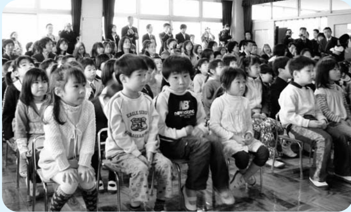
4歳児の預かり保育がはじまった幼稚園（入園式）

広野幼稚園に入園する第3子以降の園児については、入園料、保育料および預かり保育料の全額を免除し、給食費も全額補助します。