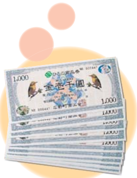
敬老会で支給される「ひろの商品券」