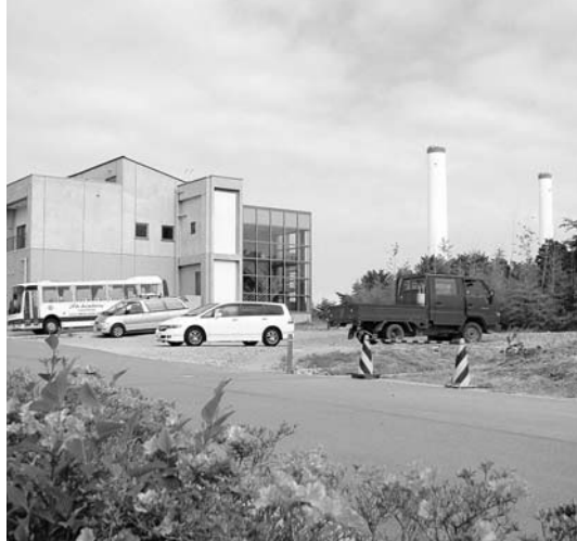
サッカー支援センター増築工事予定地