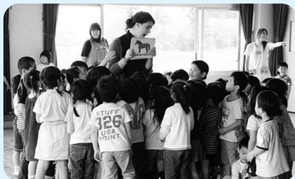
幼稚園で行なわれている英会話レッスン

4月1日から、広野幼稚園に入園する第3子以降の園児については、入園料、保育料および預かり保育料の全額が免除されるとともに、給食費も全額補助されることになりました。