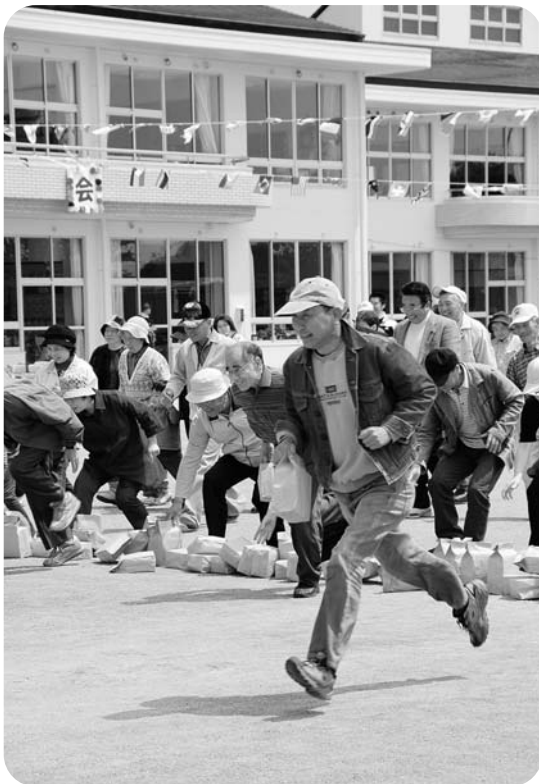
敬老宝拾い（小学校運動会）

75歳以上の方についても、7月30日からの総合検診に合わせて健康診査を受診できるようにしています。