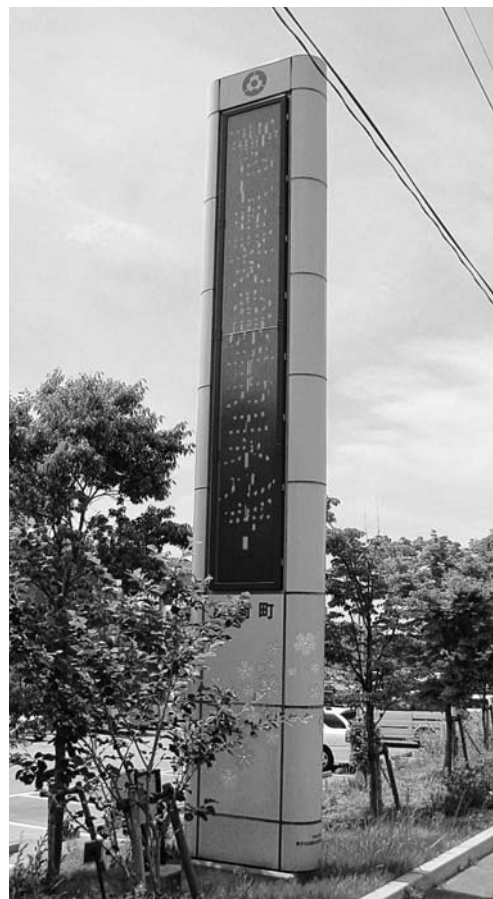
富岡町役場に設置されている電光案内掲示板