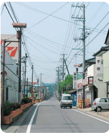
駅前通り商店街（下北迫・折返）