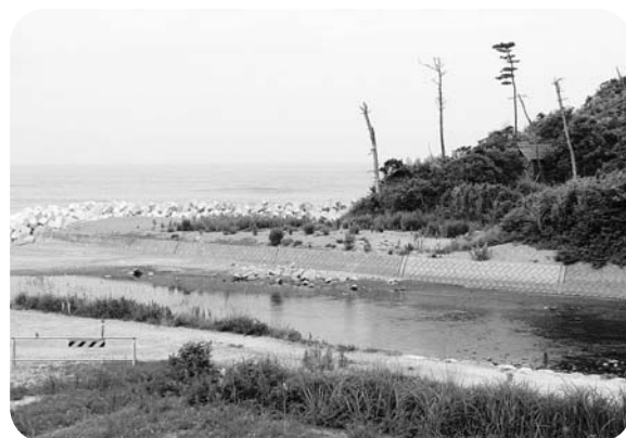
日の出橋整備予定地（浅見川河口付近）

今後とも浅見海岸一帯を観光や文化的な面からも、多くの方々の意見をうかがいながら検討していきます。