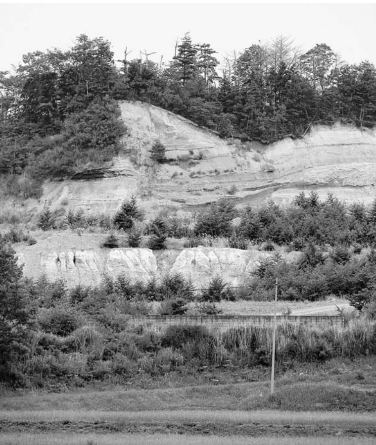
砂利採取跡地（折木字東下）

今後も県に対して認可計画のとおり跡地処理が行われるよう適切な指導をお願いしていきます。