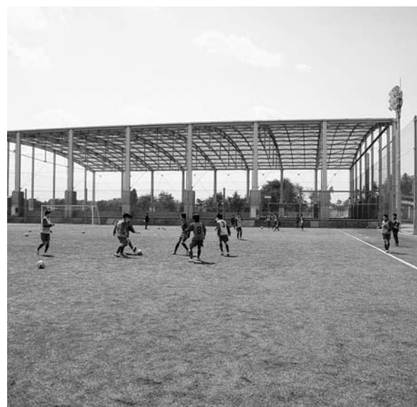
練習に励む JFA アカデミーの子どもたち