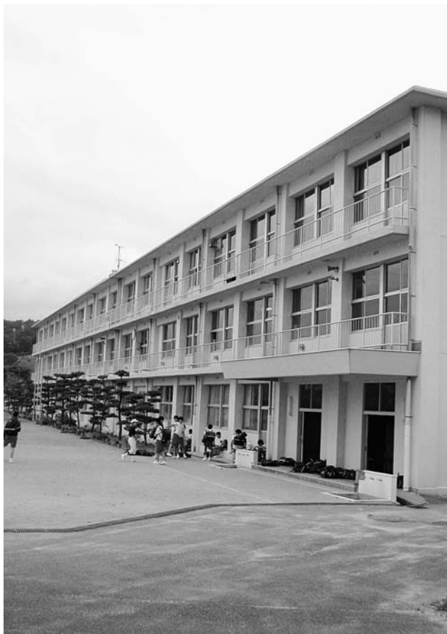
耐震補強工事が施されている中学校

6月施行の「新耐震基準」後に建築されたため、現在の耐震基準を満たしています。中学校は、平成12年度に耐震補強工事を実施しています。