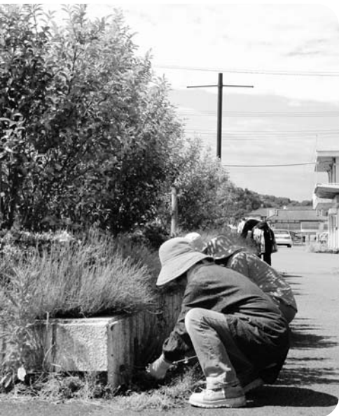
広野駅環境美化推進協議会による 花壇の除草作業

と納税の受け入れに当たっては、町は寄付金として扱うことになりませんが、これから体制を整える段階なので、まだ歳入等は見込んでいません。