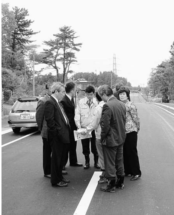
道路整備が完了した二ツ沼・大谷地原地区