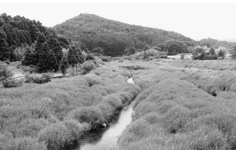
高倉山のふもとを流れる浅見川（上浅見川字切通）