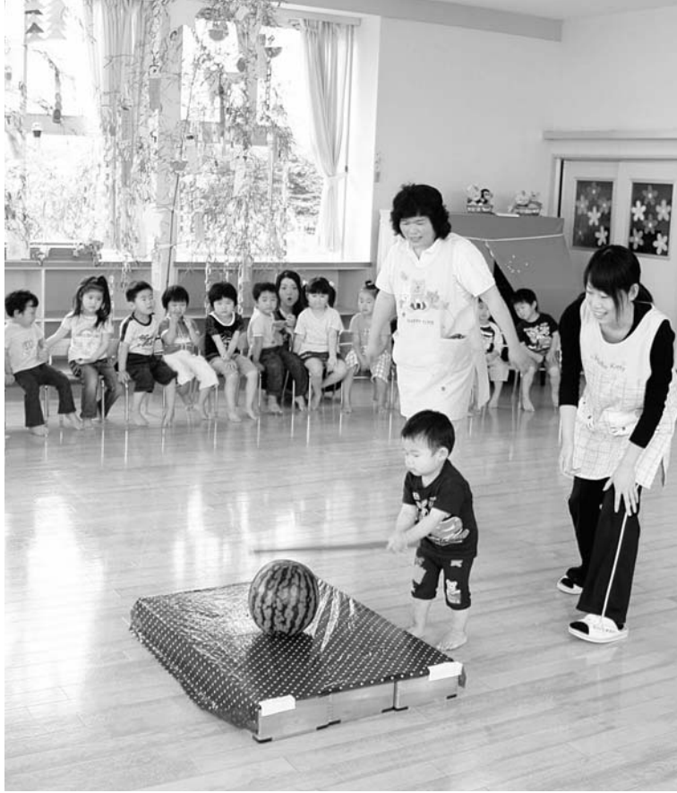
七夕スイカ割り会（保育所）