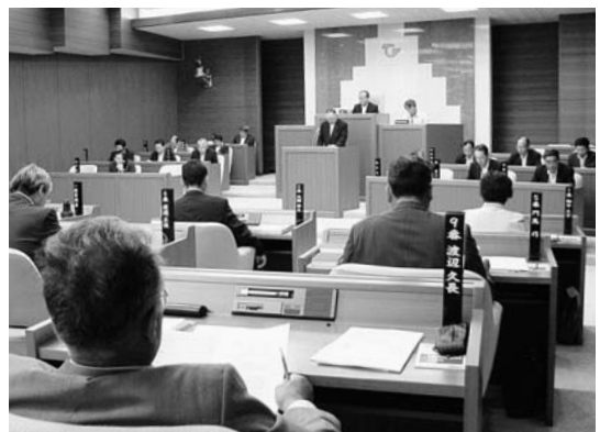
6月定例会のようす