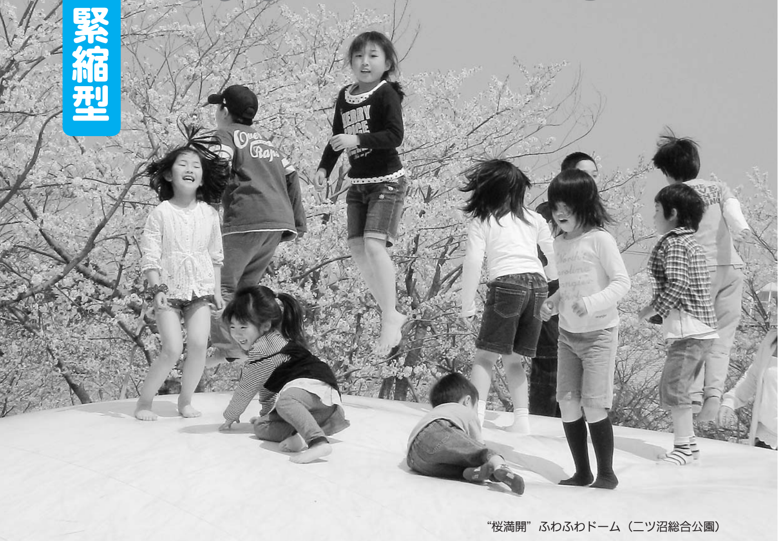
“桜満開” ふわふわドーム（二ツ沼総合公園）