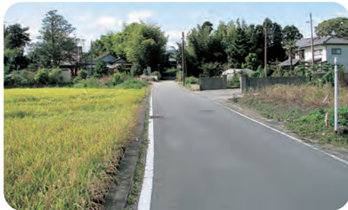
拡幅工事が計画されている町道下浅見川線

町として、幹線道路の整備はたいへん進んでいると思いますが、一方で、生活道路については対面通行のできない場所も見受けられます。