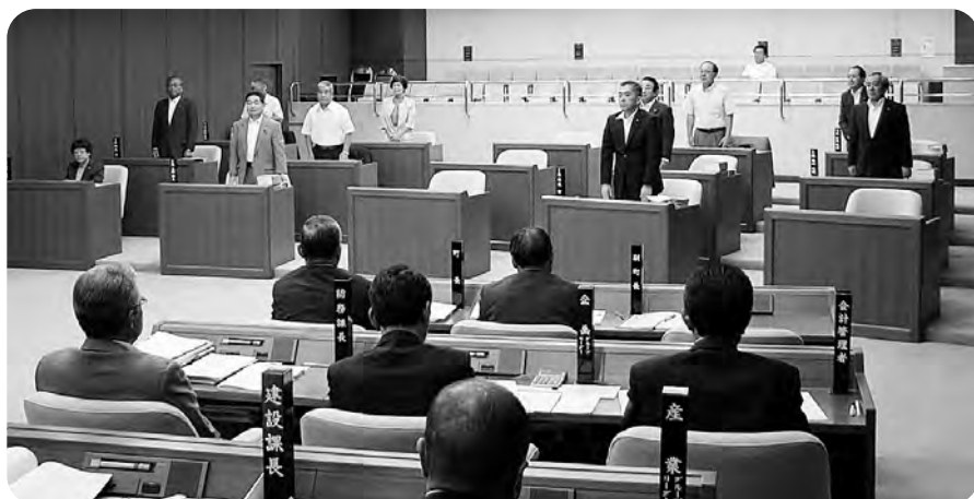
平成20年度一般会計決算認定採決のようす