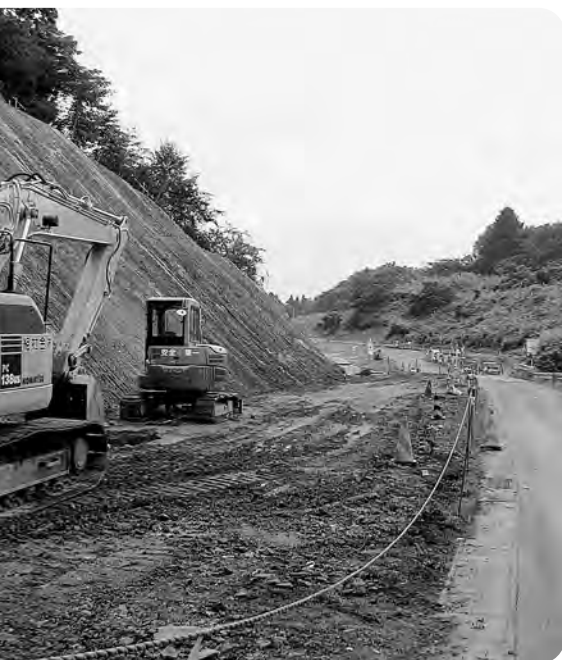
町道苗代替線改良舗装工事 (下北迫・岩作)

町内に居住される方々の雇用や町内商店の利用については、事あるごとに強く働きかけていますが、今後も可能な限り工事を請負われた会社に対してお願いしていきます。