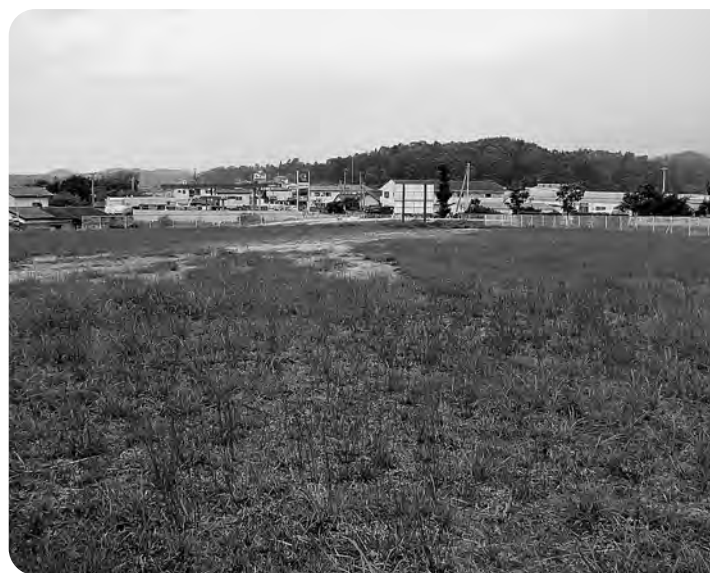
小規模宅地開発事業予定地（下北迫・大吹）

したがって、それらの調査が終わって一定の結論が出るまでは、誤解が生じないよう慎重に対応していきます。