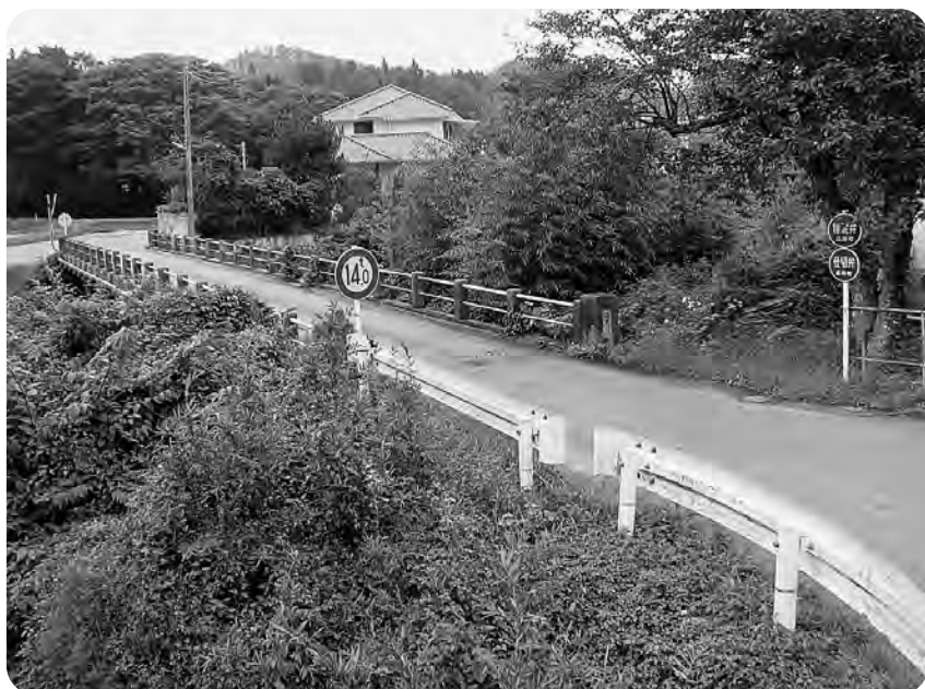
新たに改良工事が行われる町道小松・南山線