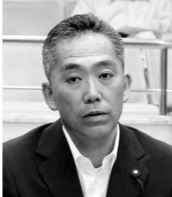
遠藤 智 議員