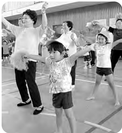
老人クラブスポーツ大会