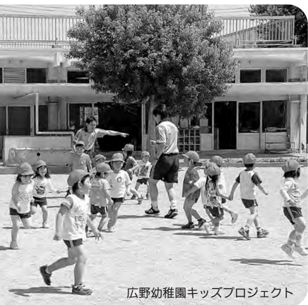
広野幼稚園キッズプロジェクト