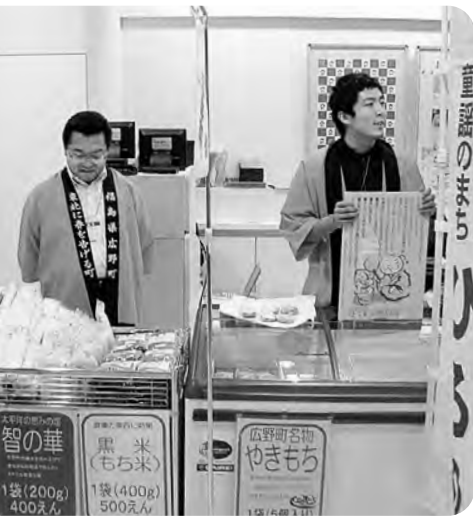
「電気のふるさと元気フェア」で地元産品をPR (東京国際フォーラム)

鍛冶屋前踏切改良工事を含めて県道停車場線から県道広野・小高線までの延長570mについては、「地域活力基盤創造交付金」を活用して整備されます。また、町道高萩・田中線整備工事については、中線整備工事については、「電源立地対策交付金等」により、日の出橋までの延長920mについては、橋りょう新設工事を含め、平成24年度までに完成させたいとのこと。