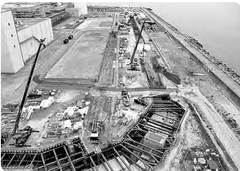
建設が進む東京電力(株)広野火力発電所6号機