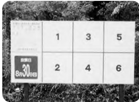
選挙ポスター掲示場

町長 昭和59年から設置されていますが、選挙管理委員会と話し合い、より良い場所への設置に努めていきます。