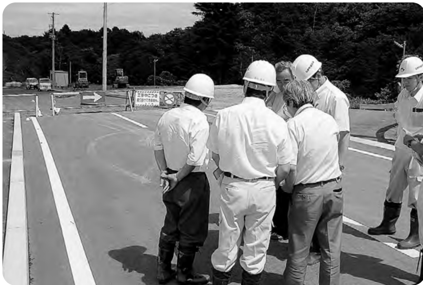
町道苗代替線の整備状況を確認する監査委員

遅れてしまった事業もあります。今回は不景気対策も含めて、雇用問題等にも還元できるように努めますのでご理解願います。