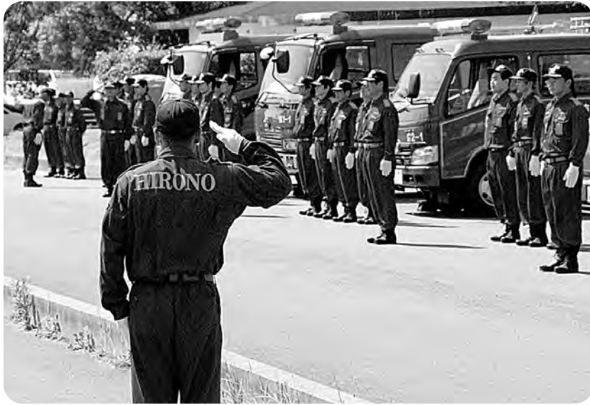
消防団および婦人消防隊秋季検閲式（総合グラウンド）

提案を聴きながら行政の運営に努めてきたところですが、さらなる住民サービスの維持・向上を目指すとともに、職員の自己啓発を促して勤労意欲を高めるため、職員がより提案しやすい環境づくりに努めます。