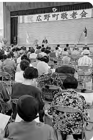
広野町敬老会（中央体育館）

なお、商品券での支給については賛否両論ありますが、趣旨をご理解いただき、ご協力願えればと思います。