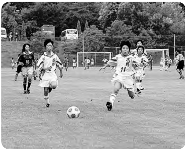
ふたばカップで健闘する広野FC（Jヴィレッジ）