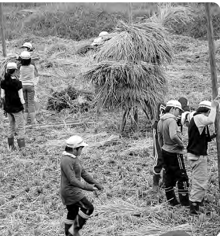
広野小学校5年生による稲刈り体験