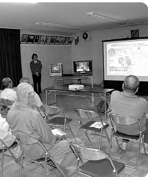
地デジ説明会（折木地区集会所）

このうち大平団地は、平成10年度から13年度にかけて改修を行っています。また、昭和56年以前に建てた住宅は耐震構造にはなっていませんが、簡易的診断では耐震基準を満たしているとの結果を得ています。