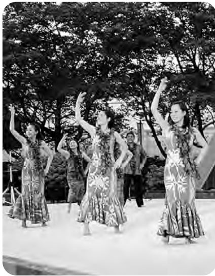
サマーフェスティバル2009 (二ツ沼総合公園)