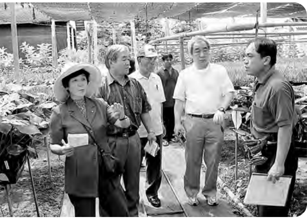
観葉植物の栽培状況を視察する委員