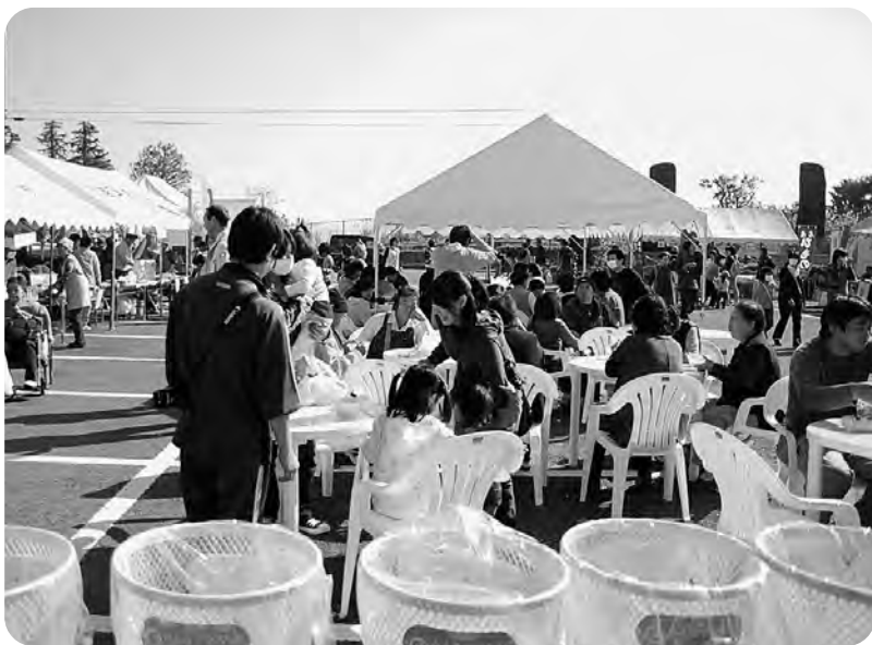
大盛況の収穫祭（中央体育館前駐車場）

しかし、国とは違い町の事業は町民生活に密着した事業が多いことから、町民の皆様のご意見をよく伺って、ご理解とご協力を得ながら進めていきたいと考えています。