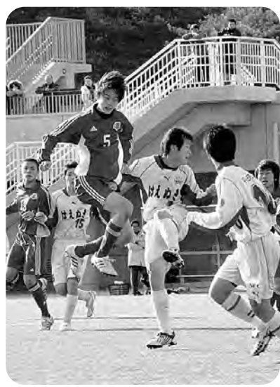
JFAアカデミーカップ (広野町サッカー場)

継続的な支援を行なっているアカデミー福島 の生徒活動については、 今後も生徒の活動状況 について情報収集や提 供に努め、当事業の趣 旨を町民にご理解いた すよう提言しました。