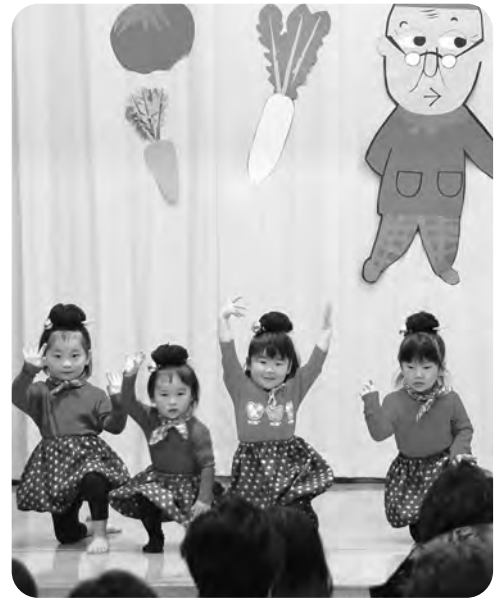
2歳児による「もったいないばあさん」 (保育所「おゆうぎ会」)