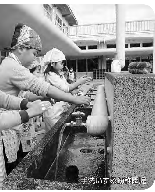
手洗いする幼稚園児

平成21年11月12日 開催 平成21年11月13日 開催 平成21年11月16日 開催