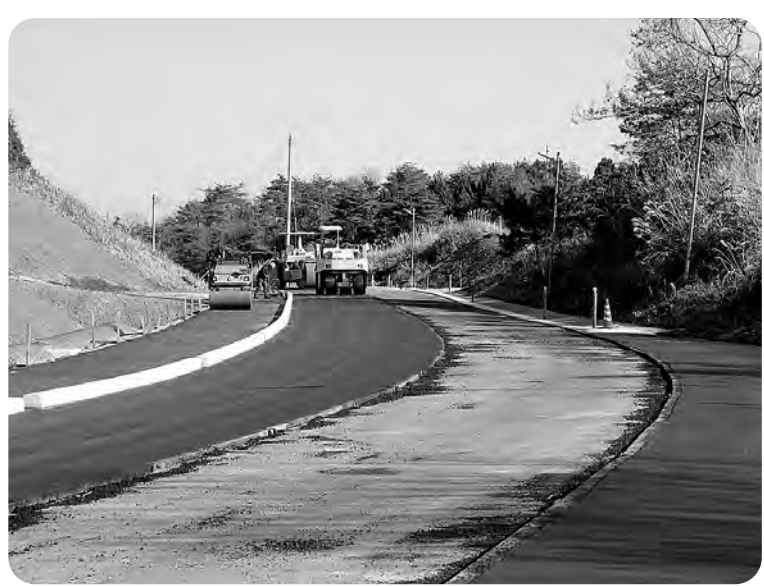
舗装が施される町道苗代替線

苗代替線整備工事の 「3工区」・「4工区」 とも工事内容の変更が あるため12月定例会に 変更契約の議案を提出 したい、また別途工事 の法面補強工事が東北 経済産業局の承認を得 られないことから、今 年度中の実施が難しい との説明を受けました。