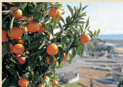
たわわに実ったみかん (中央台・みかんの丘)

人間もたくましく時代をつないでいると感じつつ、彼らに幸多かれと祈る年の始めでした。(塩)