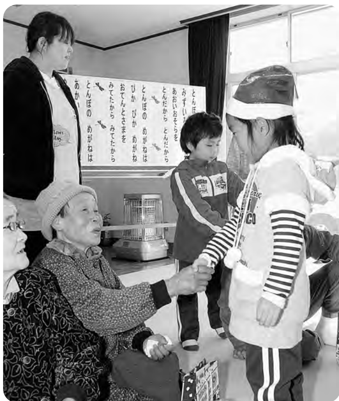
地区住民と幼稚園児の交流会（箒平地区集会所）

等、町民の皆様のご意見やご提案を聴きながら行政の運営に努めてきたところですが、さらなる住民サービスの維持、向上を目指し、新たな取り組みについても検討していきます。