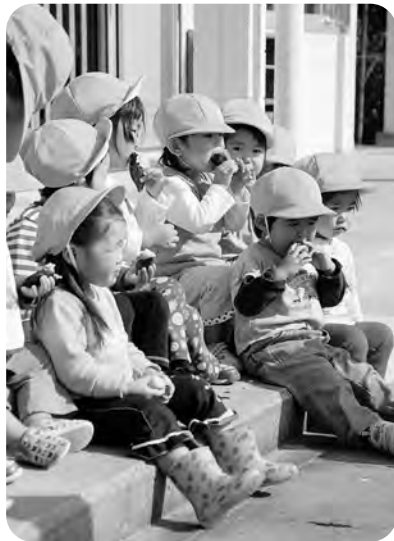
とれたてのおいもはおいしいね (保育所)

メンバーの公募状況は どうなった」といった 意見が出され、後々の メンテナンス等を考慮 して建物を整備するよ う要望しました。