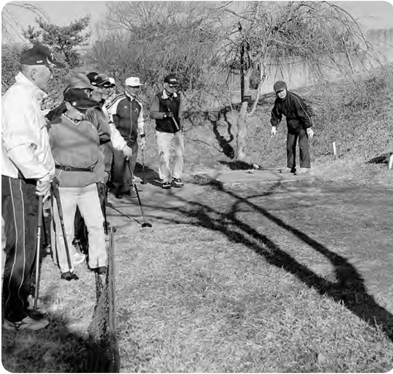
パークゴルフを楽しむ人々（二ツ沼総合公園）

対策、人材の育成、財政の健全化、農業の振興、生活基盤の整備等を重点施策として推進していきます。