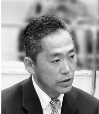
遠藤 智 議員