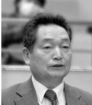
北郷 幹夫 議員