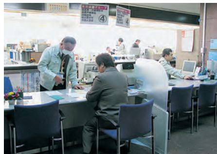
役場内に設けられている「総合案内」

町組織については、小さな町なのでグループごとに分けるのではなく、町民に優しい役場であってほしいです。 それには、役職の呼称も「課長さん」「係長さん」の方が親しみを感じると思います。 そもそも役場職員は「広野