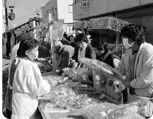
賑わいを見せる商店街（暮市）

敷地造成については、経済情勢が極めて厳しい状況ですので、実施に当たっては慎重に対応していきます。