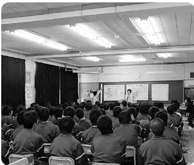
役場税務グループによる租税教室（中学校）

財政状況は年々厳しくなっていますので、道路整備に必要な財源の確保に努めていきます。国庫補助事業採択による町道の整備や、県営による道路整備や河川整備、さらに、治山事業等の推進をはかるためにも、国・県との連携を強化していきたいと考えています。また、町道整備等の事業計画については、その目的や事業効果等を検証しながら、限られた財源を有効に活用した事業計画に努めていきます。