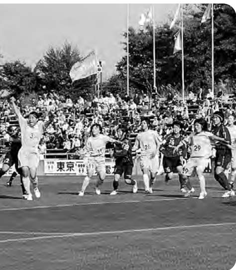
健闘するマリーゼ（Jヴィレッジスタジアム）

フラッグや看板の設置などを行ってきたところですが、ご指摘のとおりマリーゼを支援することによって、サッカーの町として地域振興に大いにつながると期待しています。今後も広報活動や観光PR等について、町と商工会および観光協会とが相互に連携・協力しながら一体となった取り組みを推進していきます。