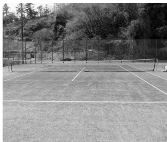
きれいに改修されたコート内 (総合グラウンドのテニスコート)

中央体育館等の使用料について、これまでの団体料金に加えて個人料金を設け、利用拡大をはかりたいとのことです。