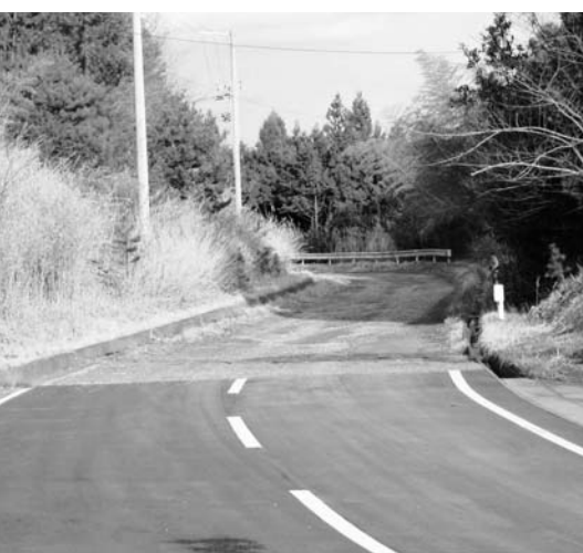
町道高萩・田中線（高萩地区）