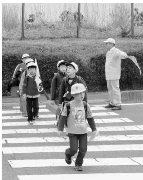
元気に登校する児童

児童・生徒等を対象とした集団予防接種は、既に半数以上が実施済みで、残る生徒の予防接種も2月中に計画し