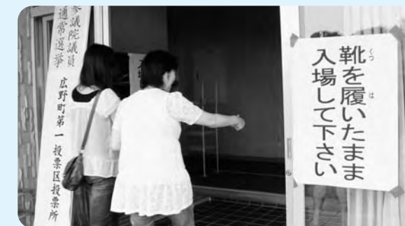
第1投票所（折木地区）

7月11日投票の参議院議員選挙より、町内すべての投票所で靴を履いたまま投票できるようになりました。