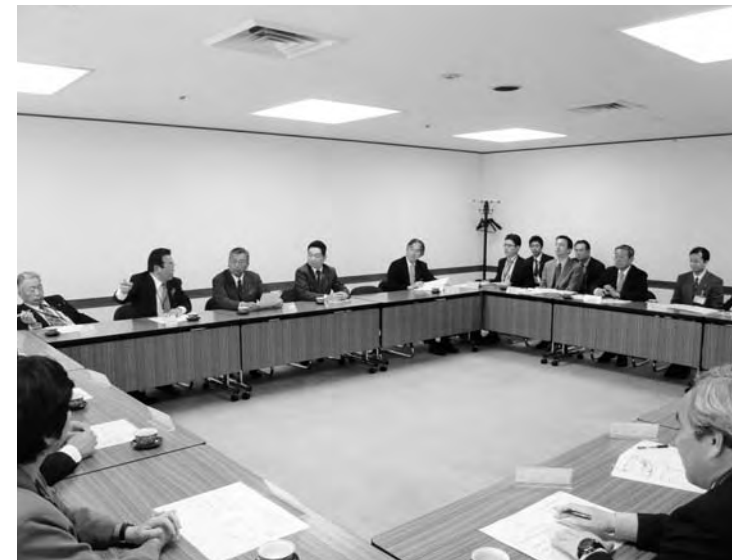
東京電力(株)本店で意見交換に臨む議員

に開催された「第1回広野町みかんロードレース大会」等への協力についての礼とともに、雇用確保や魅力ある町づくりへの一層の協力など、さまざまな意見が出されました。