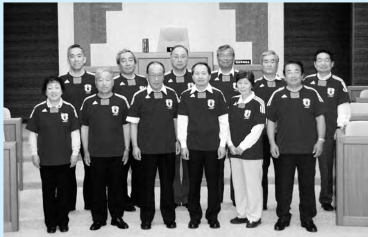
日本代表応援Tシャツで臨んだ6月定例会

6月定例会の会期中、4年に1度の「サッカーワールドカップ」が開催され、同大会に出場した日本代表を「サッカーのまち」でもある広野町が一丸となり応援しました。