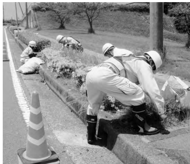
除草作業をする シルバー人材センターのみなさん(中央台)

補修工事や道路・河川等の規模の小さい維持補修工事については、建設業者として登録していない小規模業者やシルバー人材センターの活用をはかっていますので、新たに「小規模工事登録制度」を導入する考えはありません。