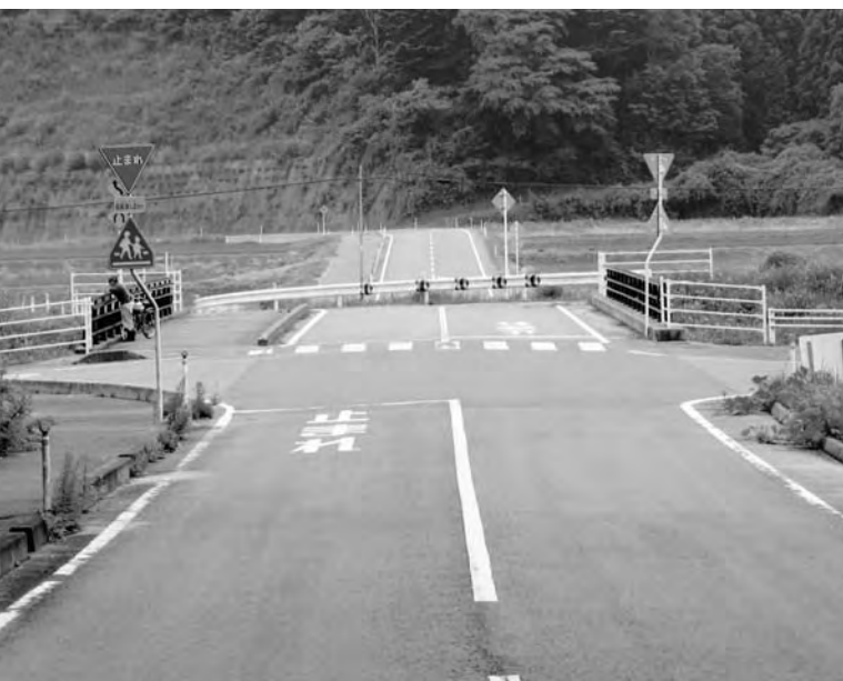
案内標識のない町道交差点（上北迫・関山地区）