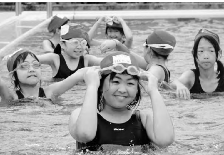
まちに待ったプールの季節 (広野小学校)

副町長は町長の補助機関として地方自治法等に規定されており、その必要性については十分理解をしていますので、時期を見て選任したいと考えています。