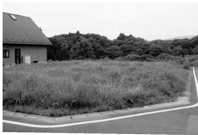
分割予定地（広洋台）