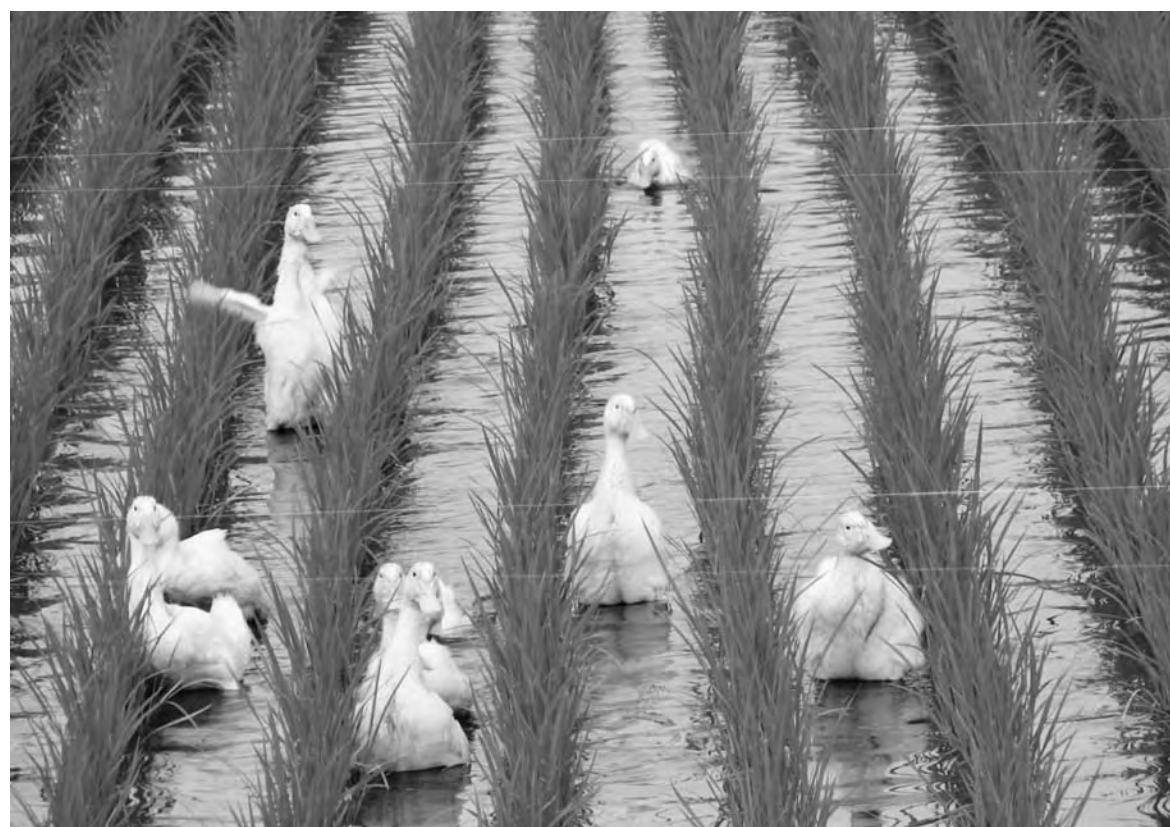
アヒル農法を取り入れた米づくり (小松地区)

率の向上や農業用水利施設の計画的更新整備に支障のないようにするために、農業農村整備に係る諸施策について積極的な展開をはかること。