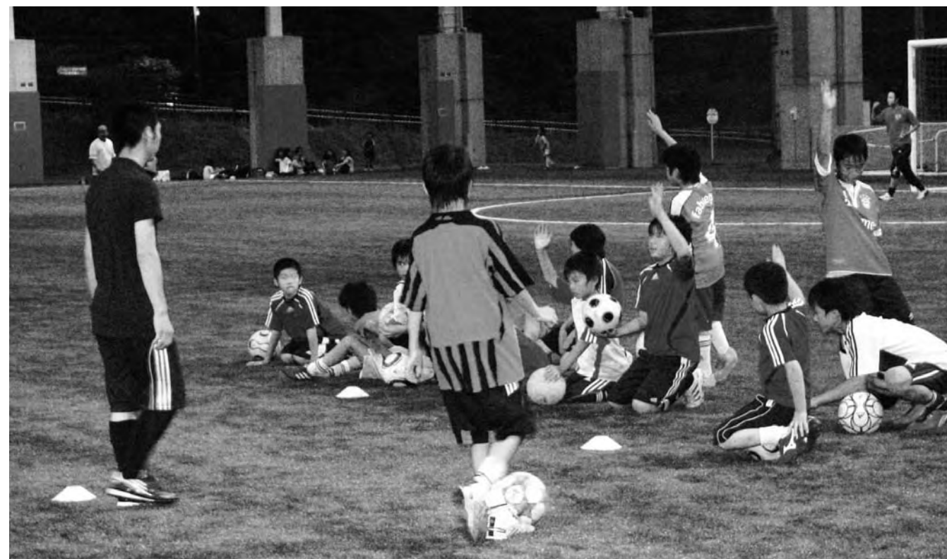
夜間も練習に励むサッカースポーツ少年団（広野町サッカー場）