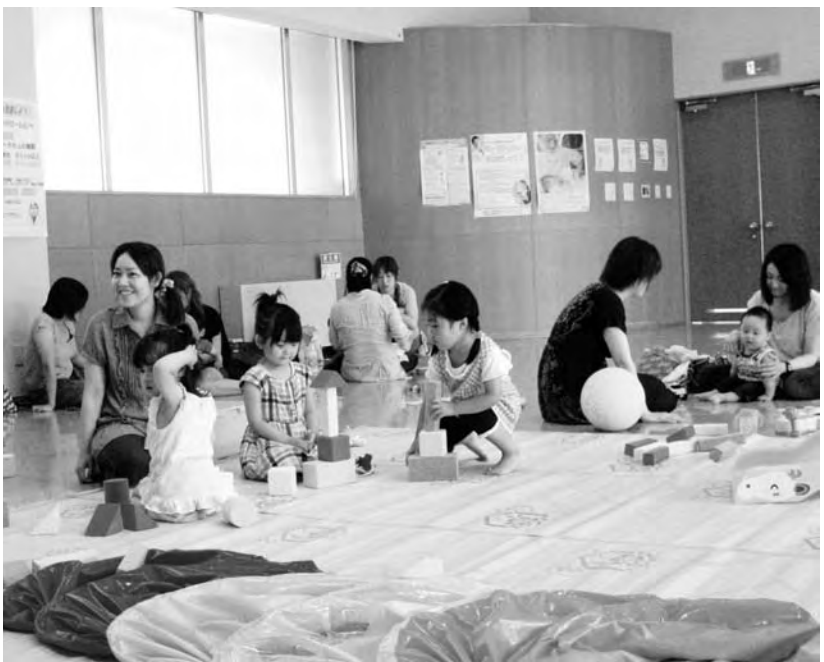
なかよしランド（保健センター）

また、当踏切改良事業と高萩・田中線の舗装は国庫補助事業の1つのパッケージ事業として国土交通省より認可をいただいているところ