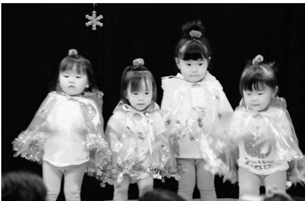
おゆうぎ会（広野町保育所）

総務文教常任委員会 平成22年5月20日 開催 産業厚生常任委員会 平成22年5月20日 開催