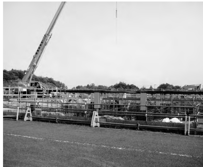
増設工事に着手した企業（広野工業団地）

北郷 緊急雇用創出基金事業の活用と雇用、就業機会創出のため、広野工業団地内企業へ積極的に雇用の働きかけをすべきではないですか。