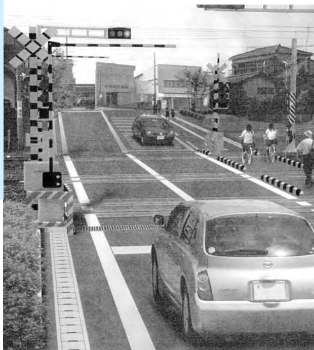
鍛冶屋前踏切拡張工事完成予想図