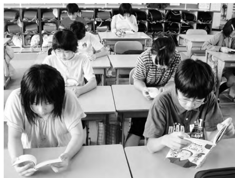
読書する児童たち（広野小学校）