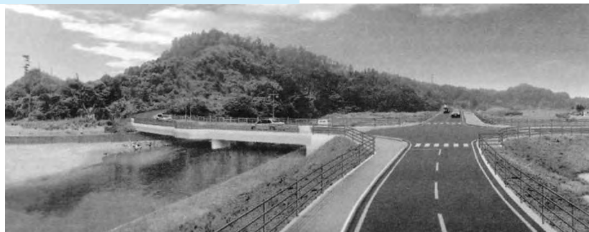
「日の出橋」周辺の完成予想図

平成22年6月定例会を6月15日から16日までの会期で開きました。 今回は、平成22年度補正予算を中心に、「広野町国民健康保険税条例の一部を改正する条例」をはじめ、提出された12の議案を慎重に審議し、すべて原案どおり可決しました。 また、「農業農村整備事業の予算確保に関する意見書」の提出を求める陳情書が提出され、全会一致で採択されました。 なお、一般質問では6人の議員が、それぞれ町の対応や考えを伺いました。