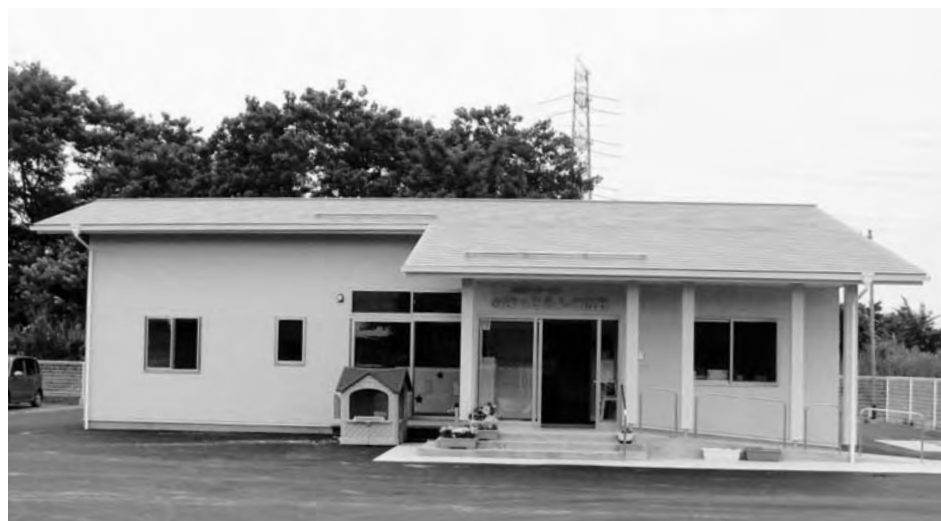
のびっこランド広野（上北迫・岩沢）

年間300万円の運営資金を3年間助成するにあたり、各年度の収支状況をもとに判断し、決定することに委員会として一致しました。