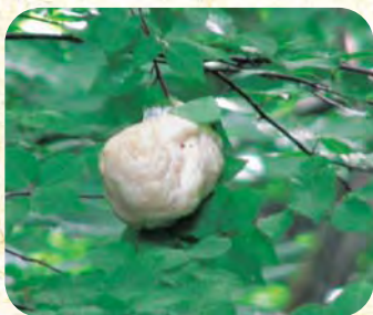
モリアオガエルのたまご (五社山)