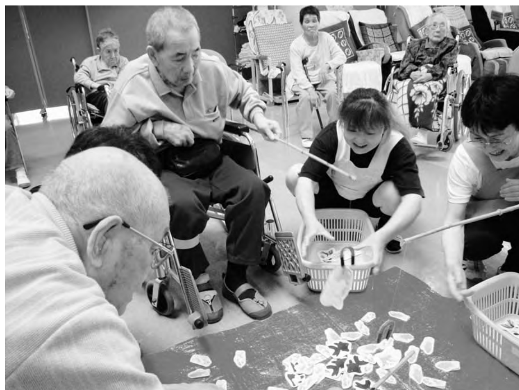
落とさないで、もう少し（広桜荘・釣りゲーム）

③「剰余金の使途」につきましては、今後の法人運営および介護報酬が減額となった場合の人員費等に充当するため、特別基金として積み立てするものですので、ご理解をいただきたいと思っております。