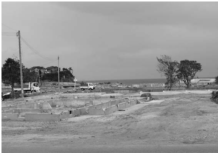
津波で大きな被害を受けた地区の固定資産税は免除されます