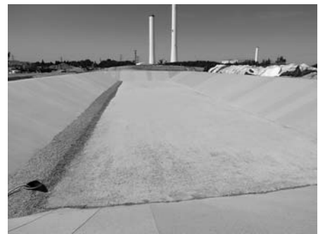
前年度整備事業の仮置き場(下北迫・東町)