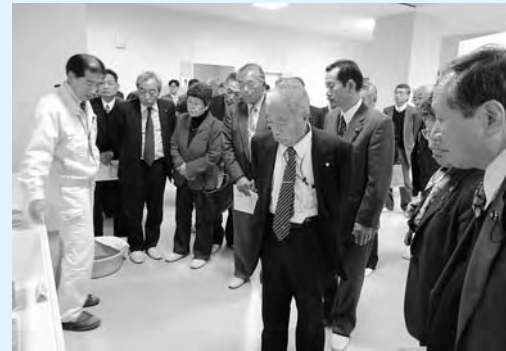
担当者から説明を受ける議員

無害化された飛灰、スラグ・メタルとして再資源化されます。また、この施設は災害廃棄物も実際に処理しています。 質疑・応答では、飛灰に含まれる放射性物質の処理や可燃・不燃を分離する方法などが示されました。