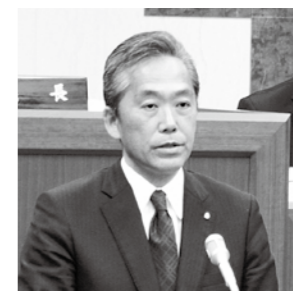
施政方針を表明する町長

平成27年度は、「ふる里復興・再生、成長の年」と位置付け、復興・再生の種が芽吹き、育つよう、着実に復興への歩みを進めます。