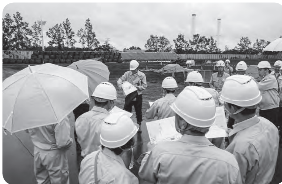
スラグ保管状況等を視察する議員(減容化施設の南に位置する保管場)