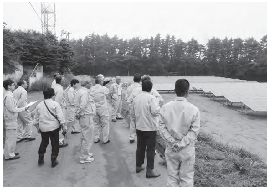
メガソーラー発電建設現場を視察

NECキャピタルソリューション(株)との共同運営による太陽光発電事業の工事進捗状況の説明がありました。 委員会は、工事スケジュールに沿って推進