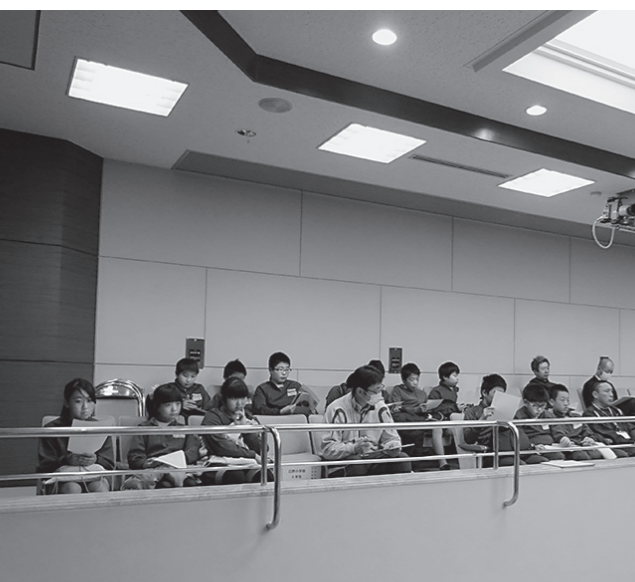
広野小学校6年生が傍聴しました