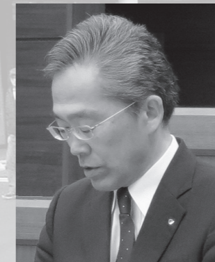
施政方針を表明する町長

平成28年度は、「ふる里復興・再生、躍動の年」と位置付け、復興への取り組みが目に見える形で具現化していく年とすべく、一步一步着実に歩みを進めていきます。