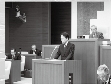
施政方針を表明する町長

平成29年度は、「ふる里復興・再生、前進の年」と位置付け、復興・再生がより着実に前進し、より大きく成長して発展する年とすべく全身全霊をささげていきます。