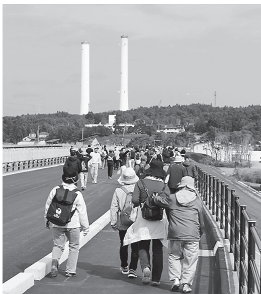
昨年の健康ウォーク

以上、災害の復興・再生と町民福祉の増進、町政発展のため、なお一層安定した財政基盤の確保及び構築に努められることを求めます。