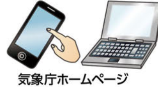
気象庁ホームページ