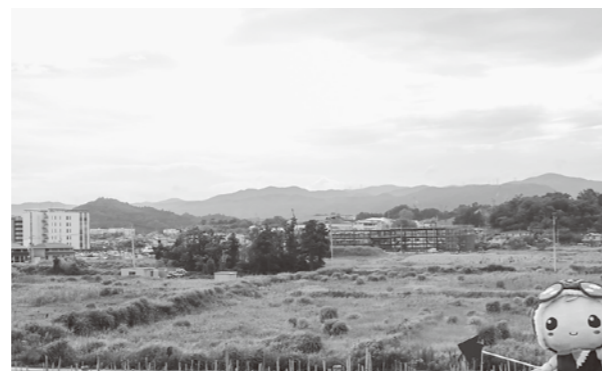
基盤整備がはじまる浅見北地区

議案第41号 事業の名称 浅見北地区基盤整備促進事業 場所 下北迫字宮田地内 区域面積 ほ場整備3.9ha うち 田 3.1ha 畑 0.1ha その他 0.7ha (道路・用水路他) 交付金 福島再生加速化交付金 事業費の負担区分 国75%+町25%+農家0%