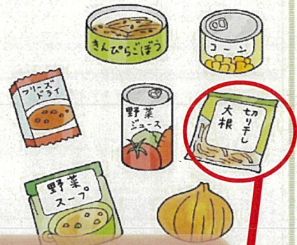
食べてローリングストック

災害時は野菜不足になり、便秘や体調不良を引き起こしやすくなります。そのため、野菜を備蓄することは重要です。野菜ジュース、野菜の缶詰・瓶詰・レトルト食品、乾燥野菜などを備蓄するようにしましょう。長期保存できるじゃがいもやたまねぎなども普段から多めに備蓄しておくとしももの時に役立ちます。